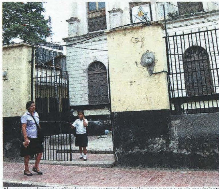
Algunas escuelas serán utilizadas como centros de votación, pero ayer no se vio movimiento.