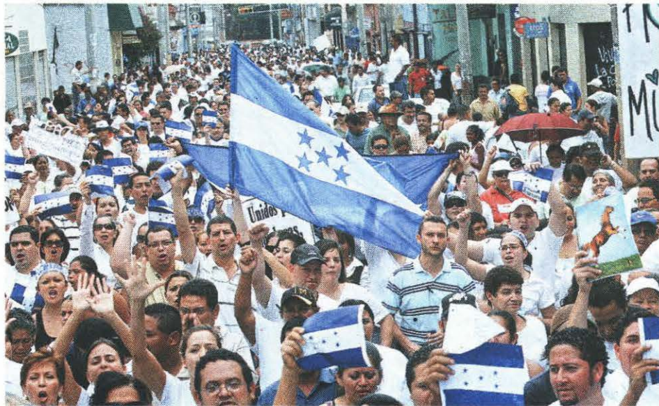
Masivas han sido las movilizaciones de los hondureños que desean que se respete el estado de derecho y que no se dé un golpe a la Constitución, como lo pretende Manuel Zelaya.

La encuesta de opinión no es vinculante, por lo que sus resultados no obligan al Congreso Nacional a aprobar la instalación de una cuarta urna en las elecciones nacionales de noviembre, pese a que el gobierno presiona para que sea aprobada.