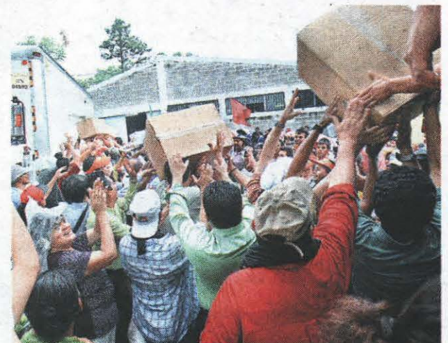
Una turba de manifestantes, encabezada por Zelaya, irrumpió en la FAH a sacar las urnas, pese a que la Fiscalía las tenía en depósito.