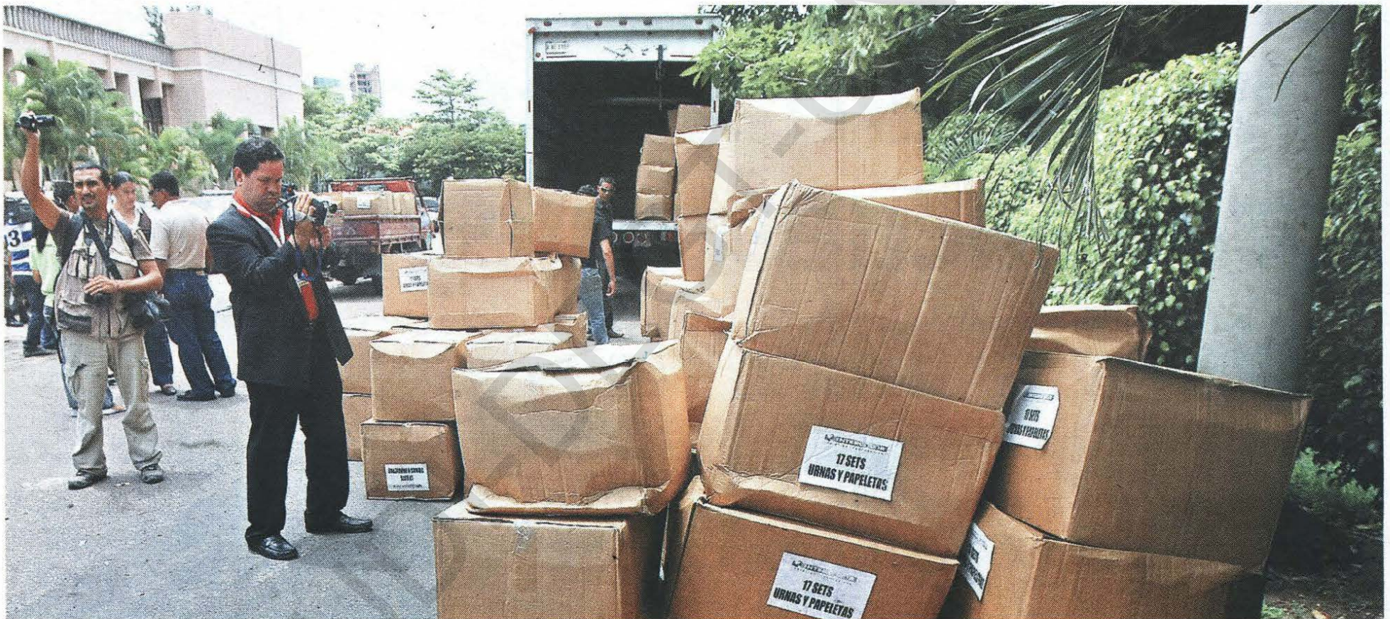
Los funcionarios de Casa de Gobierno serán investigados por servir de bodega y centro de distribución de las urnas para la encuesta de opinión de este domingo.