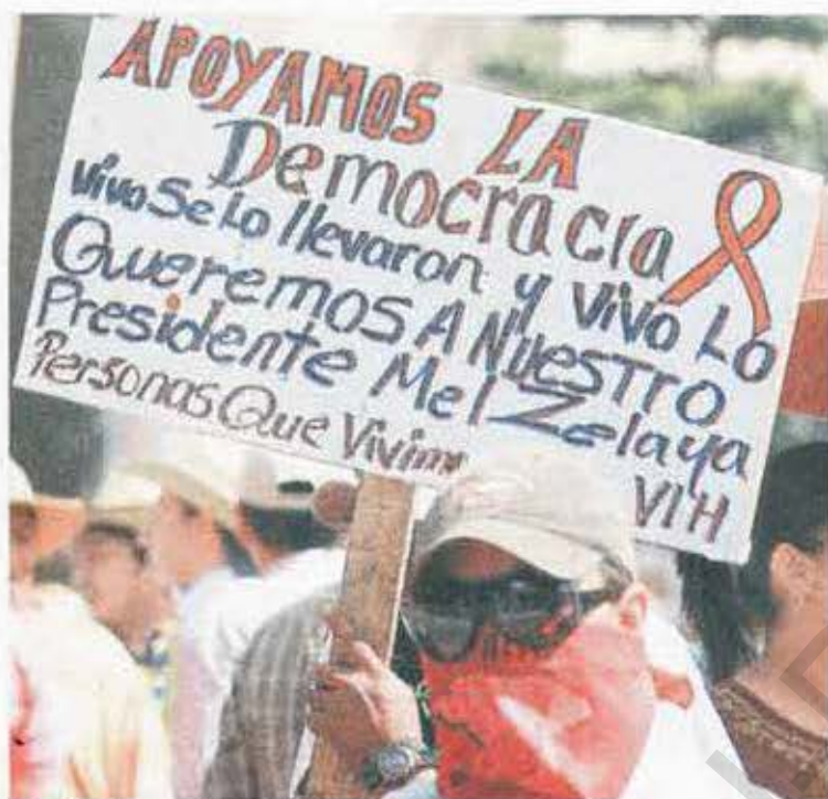
Lucha. Los protestantes afirman que defienden la democracia del país.

Unos tres mil manifestantes protestaron en las calles de Tegucigalpa para exigir la restitución de Manuel Zelaya en la presidencia de la República