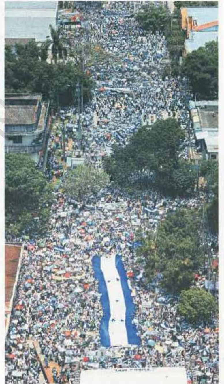
Respaldo. El sagrado Pabellón Nacional fue el estandarte que acompañó a los más de 50 mil manifestantes.