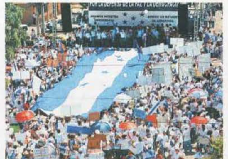
Marea blanca. Unidos en una sola voz, miles de habitantes de la zona norte apoyaron al nuevo gobierno.