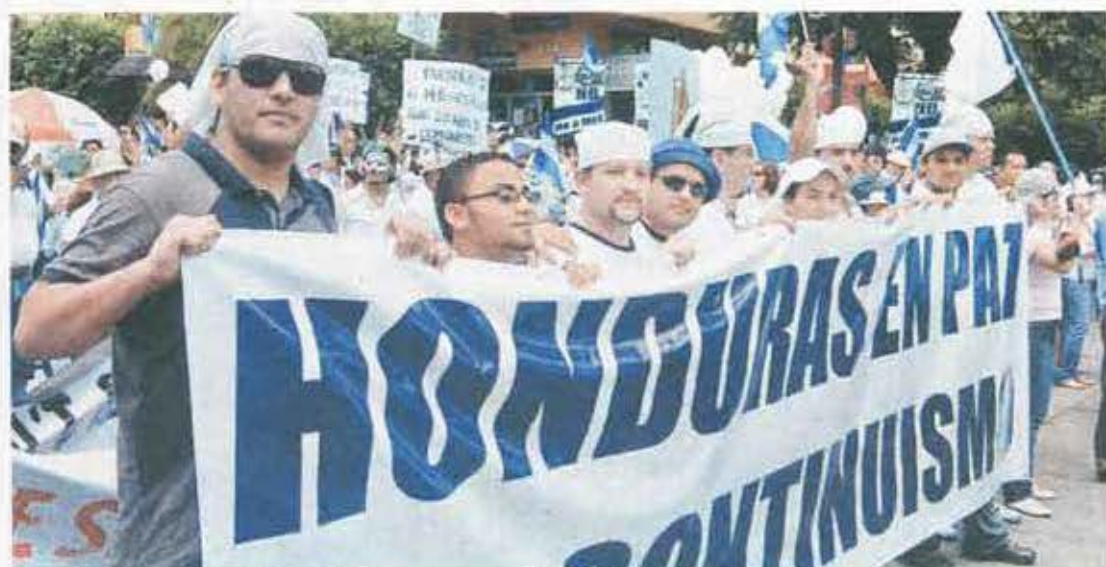
Juventud presente. Miles estuvieron congregados en el barrio Los Andes de San Pedro Sula expresándose en defensa de la democracia.