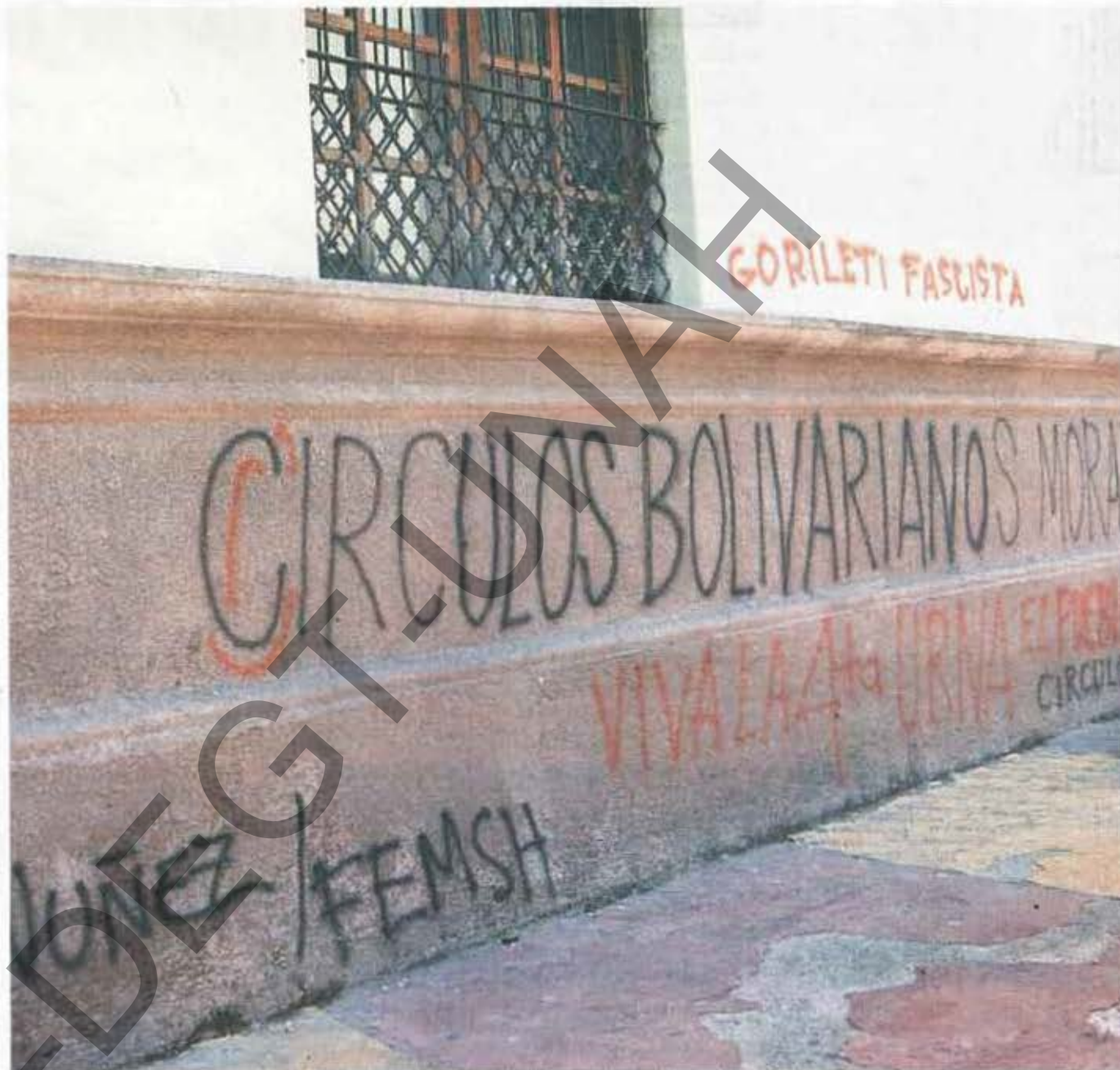
Los protestantes no respetaron ni la Iglesia La Merced y la Galería Nacional de Arte, ubicadas en el centro de Tegucigalpa.