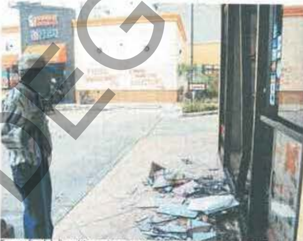
En medio del disturbio, varios negocios resultaron severamente dañados.