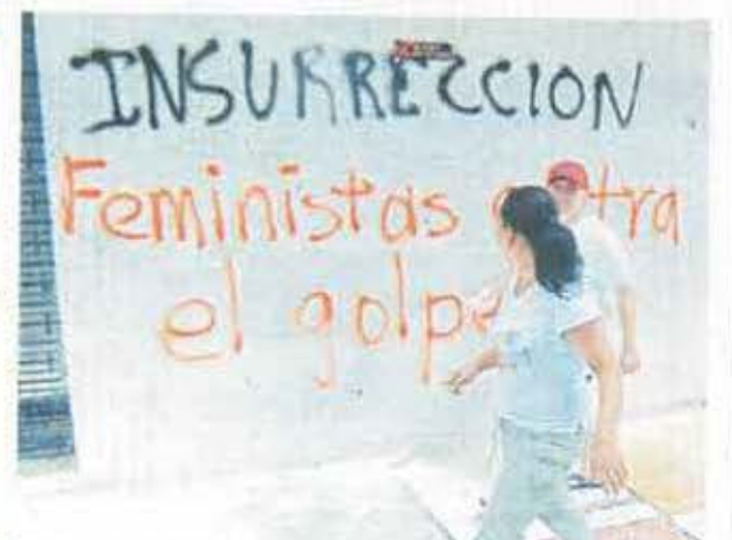
Los protestantes mancharon varios inmuebles de propiedad privada.