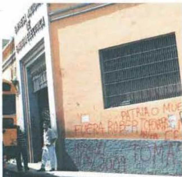
El antiguo edificio de la ENEE, que data desde 1913, está tapizado de grafiti.