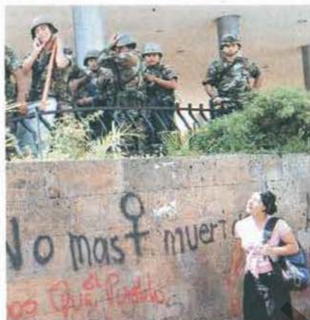
Los vándalos rayaron las paredes del Congreso Nacional.