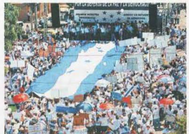
Marea blanca. Unidos en una sola voz, miles de habitantes de la zona norte apoyaron al nuevo gobierno.