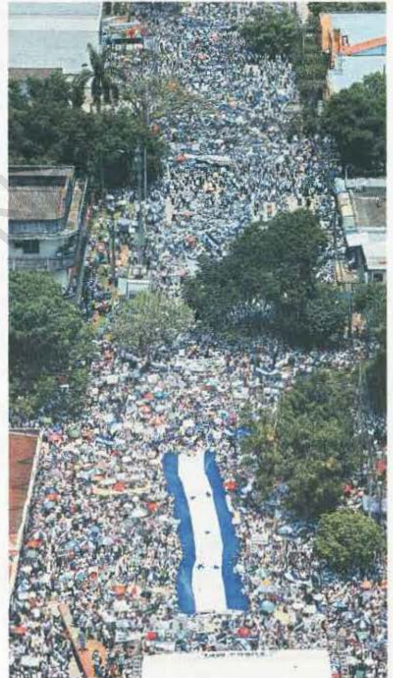
Respaldo. El sagrado Pabellón Nacional fue el estandarte que acompañó a los más de 50 mil manifestantes.