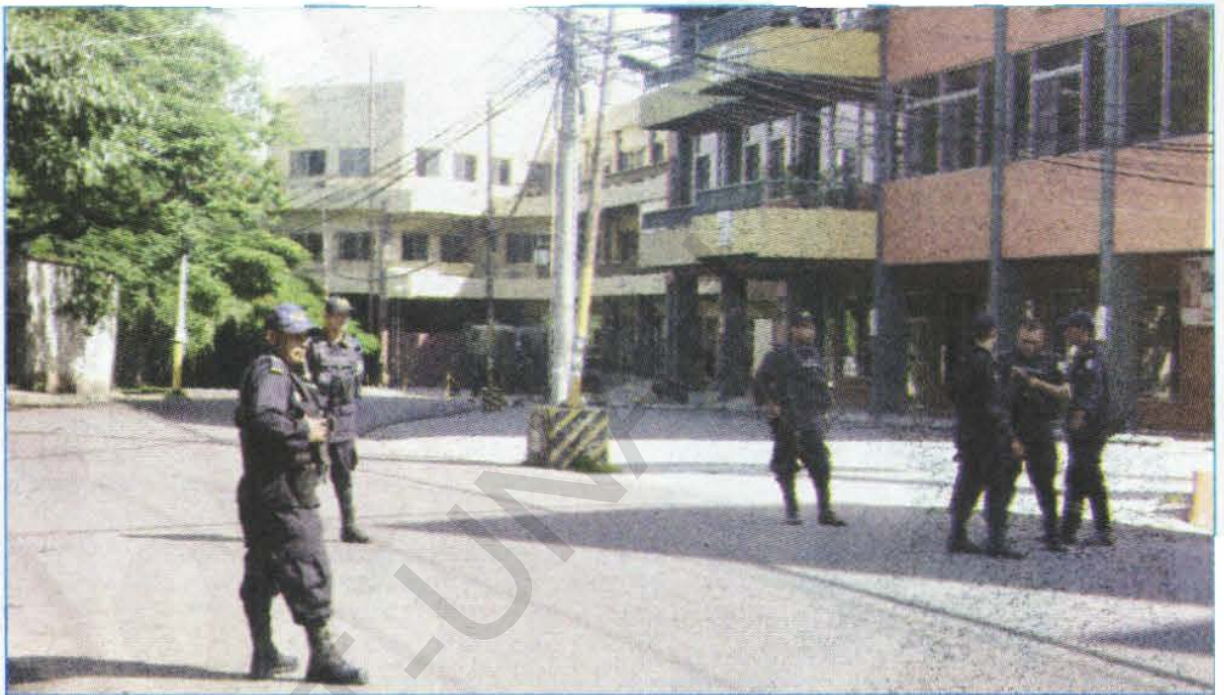
Las instalaciones del MP seguirán resguardadas por los militares y policía, mientras se llegue a la normalidad en sus funciones.

En relación a las personas que fueron detenidas por orden judicial al promover las intenciones del ex mandatario Zelaya, Ferrera no quiso responder al respecto en vista que el fiscal general del Estado, Luis Alberto Rubí, "es el único que puede dar más in-