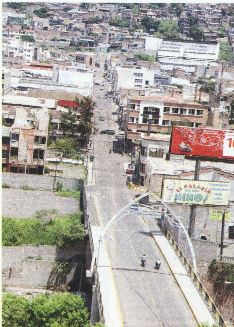
La soledad imperó hasta en sectores de Comayagüela que normalmente se observan congestionados los domingos.