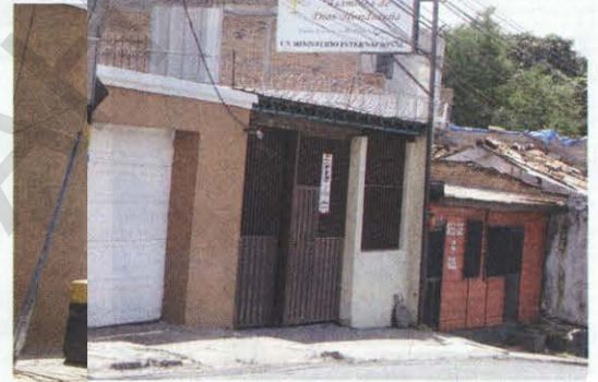
La mayoría de las iglesias evangélicas suspendieron su actividad dominical.