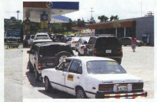
filas de vehículos eran impresionantes en varias estaciones.