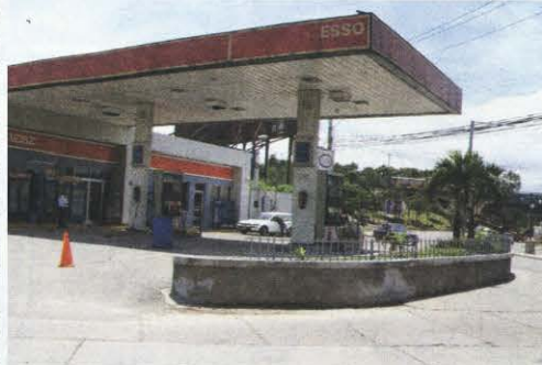
Después del mediodía algunas gasolineras reportaron que ya no tenían combustible.

Después del mediodía, imperaba un ambiente de calma y tranquilidad, sin embargo persistía la incertidumbre de lo que podía acontecer esta semana.