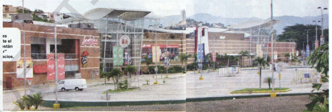
Después de la situación se observó tranquilidad en las calles.