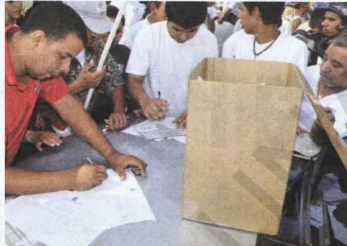
El Sitraunah persistían en cumplir con la consulta popular, pese a que fue calificada por el juzgado.