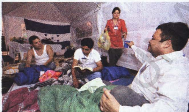
La huelga de los fiscales duró más de un mes.

El 7 de abril 2008, fiscales se pusieron en huelga de hambre para pedir que se les deje investigar casos de corrupción que según quieren demostrar han quedado archivados en el cajón del fiscal general. El movimiento, que recibió el apoyo de diversos sectores sociales del país, culminó el 15 de mayo con una proclama de los participantes destacando la promesa del Ministerio Público de investigar los casos aludidos. En su momento se dijo que esta huelga fue patrocinada por Casa de Gobierno para afectar políticamente al presidente del Congreso, Roberto Micheletti.