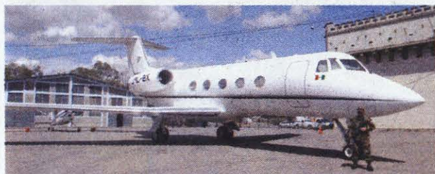
El misterioso jet, el primer enredo de la administración.

El caso del misterioso avión jet, que aterrizó la noche del 24 de febrero de 2006 en el aeropuerto internacional Toncontín, se convirtió en otro de los hechos más comentados en el país con ribetes de escándalo internacional por muchos meses. Desde un principio se tejieron muchas conjeturas sobre la procedencia y el contenido de la aeronave. Se determinó que volaba con bandera mexicana, pero nunca se supo las razones de su aterrizaje en la capital hondureña. Al final, un año después fue subastado y vendido a una empresa norteamericana por 736 mil dólares (14 millones de lempiras) sin que nadie haya dado una respuesta para quién venía, ni qué traía.