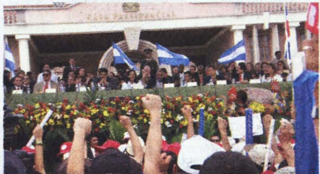
La firma de la ALBA, fue una de las decisiones más controversiales de Zelaya.

El presidente hondureño Manuel Zelaya firma en una ceremonia la adhesión de Honduras a la Alternativa Bolivariana para las Américas (ALBA), con la presencia de sus pares Hugo Chávez (Venezuela), Evo Morales (Bolivia) y Daniel Ortega