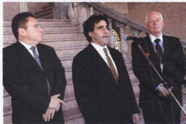
La licitación internacional fue un proceso fracasado.

El Presidente Manuel Zelaya Rosales presentó al Consejo de Ministros las bases para la licitación internacional de combustibles y el mismo día las remitió al Congreso Nacional para su discusión y aprobación. En la licitación participaron 60 firmas internacionales del rubro siendo la estadounidense Conoco Phillips la ganadora. El proceso se quedó en el camino porque esta empresa al final declinó mantener la oferta en vista que no tenía tanques de almacenamiento en el país. Al final, el mandatario emitió un decreto cambiando la fórmula de comercialización del producto, que automáticamente produjo una rebaja alrededor de tres lempiras a la gasolina, provocando el rechazo airado de los empresarios del rubro.