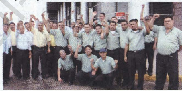
El cierre de Toncontín le causó problemas al gobierno.

El Presidente Manuel Zelaya Rosales ordenó el cierre del Aeropuerto Internacional de Toncontín, de Tegucigalpa, luego de un accidente de un avión de la compañía TACA, lo que provocó pérdidas millonarias a empresarios del turismo, comerciantes y otros sectores. Como alternativa para los vuelos comerciales, el mandatario anunció la habilitación de una pista alterna a apertura de la base militar estadounidense afincada en Palmerola, Comayagua. Tras fuertes presiones de muchos sectores capitalinos, la terminal aérea fue abierta un mes después aunque Zelaya siempre continuó con la idea de Palmerola.