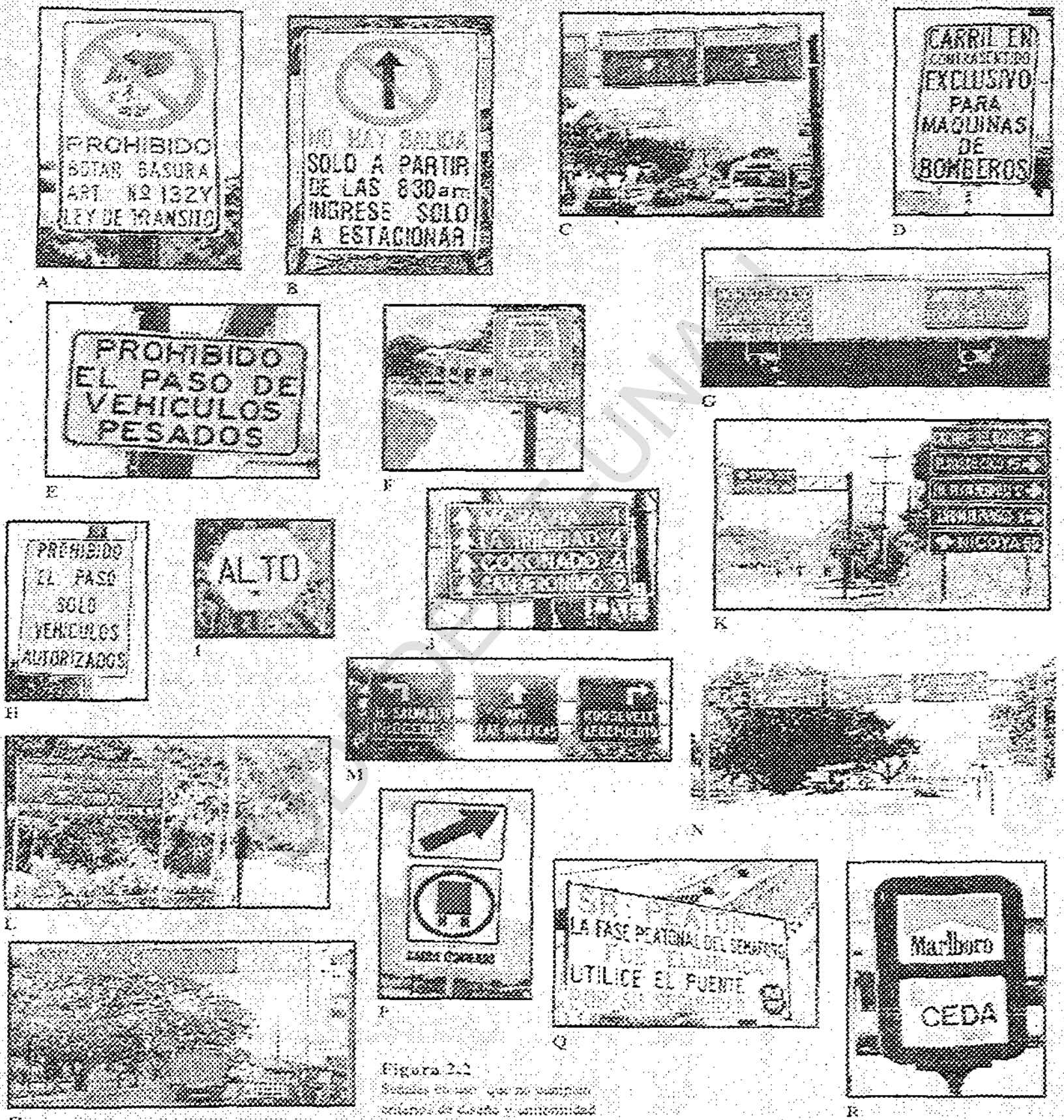
Figura 2.1 Señales de uso que no cumplen criterios de diseño y uniformidad