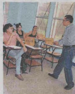
Los docentes siguen recibiendo su salario.

La máxima casa de estudios ha informado que diariamente se pierden unos 3.8 millones de lempiras