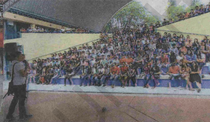
(1) Los jóvenes integrantes del MEU realizaron una marcha el viernes anterior para exigir que 75 compañeros acusados por participar en las tomas fueran sobreseídos. (2) Durante más de 45 días los edificios de la ciudad universitaria han permanecido tomados, lo que ha generado que se suspendan las clases y millonarias pérdidas para la UNAH. (3) Unos 12 mil becarios perderán la asistencia debido a que no pueden ser evaluados. Algunos de ellos se reunieron en la UNAH la semana pasada.