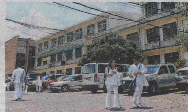
Las tres carreras únicamente tienen dos periodos académicos al año, las clases para ellos comienzan el 21 de julio.

—TEGUCIGALPA La Universidad Nacional Autónoma de Honduras (UNAH) convocó a los estudiantes de las carreras de Medicina, Enfermería y Arquitectura a realizar su proceso de matrícula a partir de hoy.