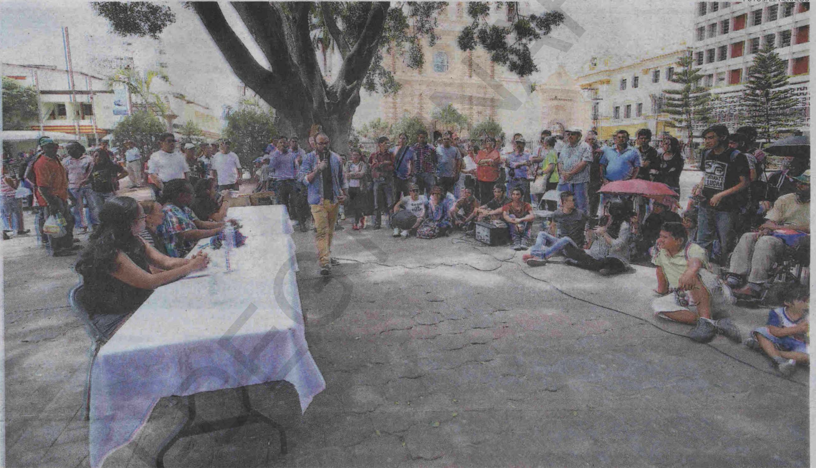
Los integrantes del Movimiento Estudiantil Universitario sostuvieron un foro el sábado pasado al que estaban invitados exrectores, pero estos no asistieron. Durante el fin de semana hubo algunos contactos entre los estudiantes y autoridades universitarias, acordaron sostener una reunión esta semana.