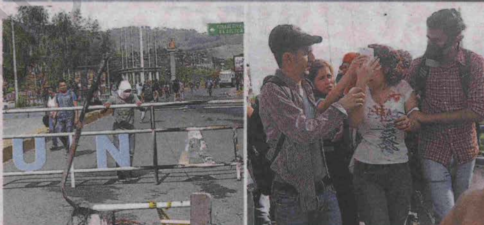
ACCIONES. Encapuchados lanzaron piedras y palos, por lo que los policías respondieron con gases. Estudiantes resultaron heridos por el enfrentamiento.

no brinda las condiciones académicas necesarias para que puedan cumplir estas normas.