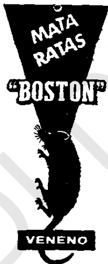
Deposito de Droguería Nacional, S. A. San Pedro Sula - Honduras

La infrascrita, Jefe de la Sección de Patentes y Marcas de Fábrica, dependiente de la Secretaría de Economía y Hacienda, hace saber: que con fecha siete de septiembre del año en curso, se admitió la solicitud que dice: "Registro y depósito de una marca de fábrica.— Poder Ejecutivo.— Secretaría de Economía y Hacienda.—En representación de la compañía Droguería Nacional, S. A., una sociedad anónima hondureña, domiciliada en San Pedro Sula, Honduras, según el poder que obra en esa Secretaría de Estado, respetuosamente comparezco a solicitar el registro y depósito de la marca de fábrica denominada "Mata Ratas Boston",