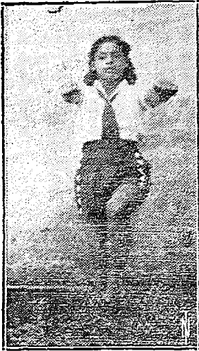
Fig. VI.—Ejercicios combinados de piernas y brazos.—Movimiento de frente.

I.—EJERCICIOS COMBINADOS DE PIERNAS Y BRAZOS.—Tienen por objeto enseñar la independencia y la coordinación de los movimientos; se le complicará haciéndolos asimétricos.