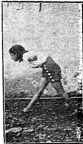
Fig. VII.—Ejercicios de Extensión dorsal.

III. — EJERCICIOS DE SUSPENSIÓN.— Los ejercicios de suspensión son los que sirven para sostener el peso del cuerpo, en totalidad o en parte, por los brazos. — Estos ejercicios hacen trabajar de una manera enérgica, no solamente los músculos del brazo, sino también los músculos del omoplato; ponen en juego particularmente el gran dorsal, cuya tonicidad es tan útil para mantener la buena posición del ángulo del omoplato.