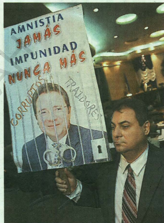
El diputado Wenceslao Lara se proclamó en contra de la amnistía.

Wenceslao Lara, tras mantener en alto la pancarta protesta, dijo que “estoy totalmente en contra de cualquier amnistía para los empleados que se han apropiado aunque sea de la mitad de un cinco que sea del gobierno