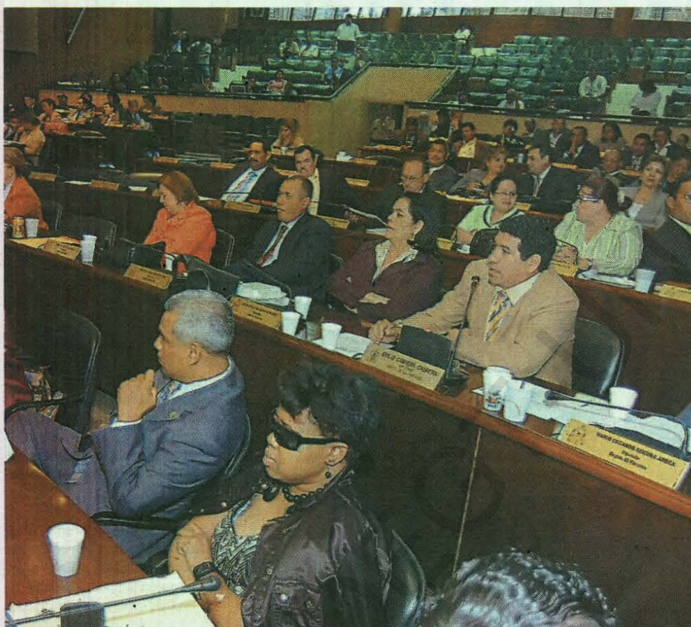
La comisión dictaminadora tiene plazo hasta este jueves para pronunciarse sobre la propuesta de la amnistía.