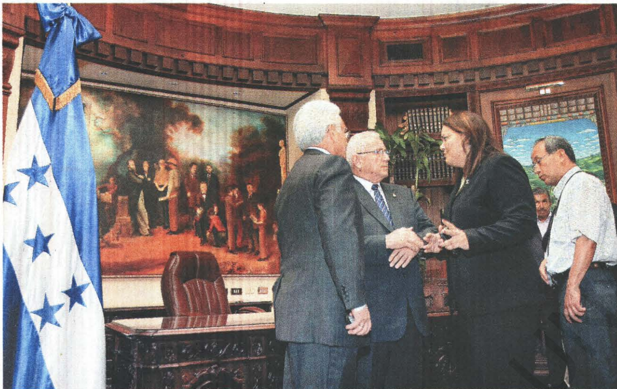
Diplomacia. Ayer fue un día de planificación en el gobierno para aplicar la ofensiva diplomática con el fin de explicar al mundo las razones por las que se destituyó a Manuel Zelaya.