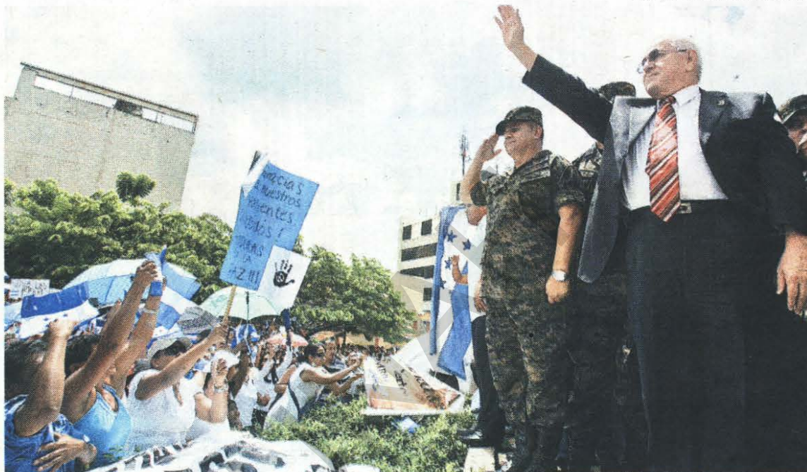
Juventud. Micheletti y Vázquez Velásquez saludaron y agradecieron el apoyo del pueblo hondureño.

defensa del respeto de la ley y la democracia. El agradecimiento también fue para ese grupo de mujeres que sin temor salieron a la calle a protestar, a esos hombres que no tuvieron miedo a las amenazas del gobierno anterior y a los reservistas de las Fuerzas Armadas que supieron despertar el amor del ciudadano hacia su país.