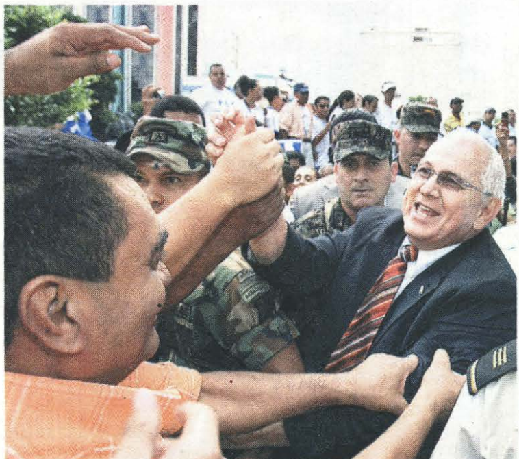
Ingreso. Inesperadamente el presidente provisional Roberto Micheletti se presentó ante la multitud.