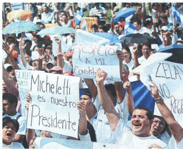
Presencia. Los manifestantes no pararon de gritar consignas a favor de la Constitución y la democracia.

vieron obligados a dispersarse. Estos hechos ocurrían en el país, mientras el depuesto Presidente comparecía ante la Organización de las Naciones Unidas, haciendo un relato de su captura y expulsión de Honduras. Incluso en algunos momentos llegó a mencionar que en el país había una huelga general de los trabajadores y que una multitud se encontraba en las calles exigiendo su regreso. La cadena CNN, sin embargo, mostró al mundo las imágenes y aclaró que era una marcha que más bien ni quería ver a Zelaya en el país.