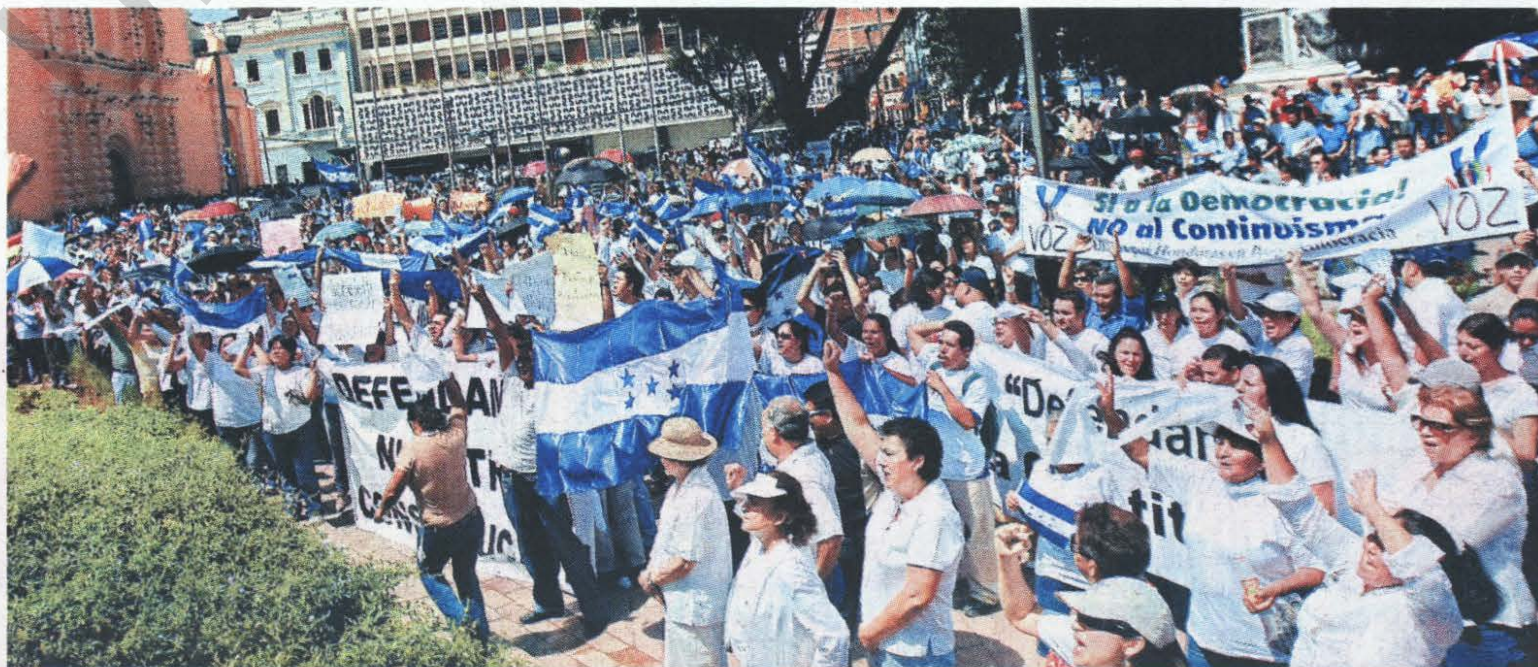
Multitud. La plaza Central resultó pequeña para la gran cantidad de gente que llegó voluntariamente a respaldar a las nuevas autoridades del país.