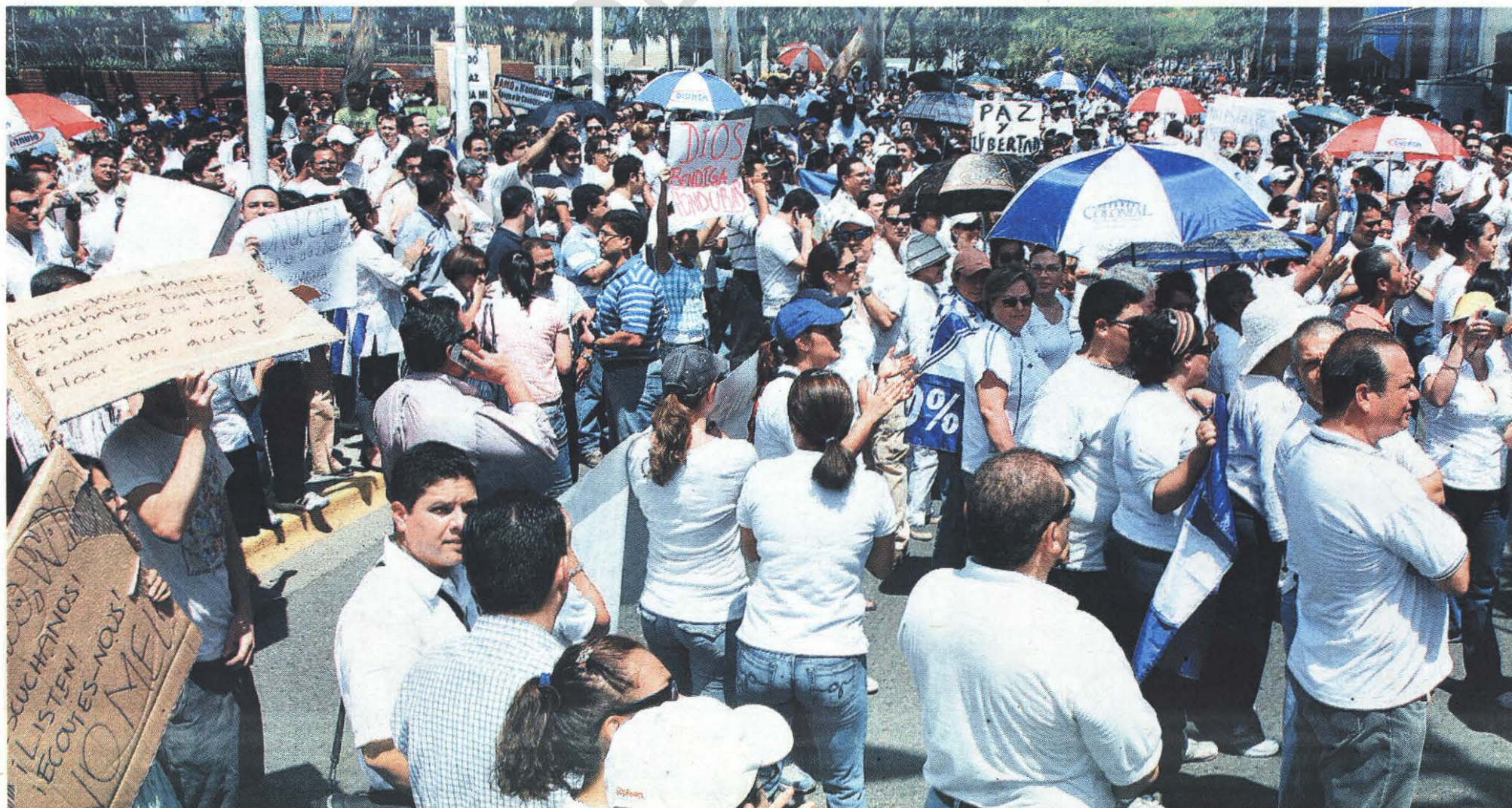
Apoyo. Una nota que circuló por Internet bastó para que los sampedranos llegaron a las calles a manifestarse a favor de la paz y la democracia.