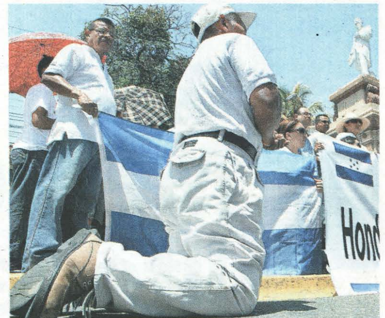
Oraciones. De rodillas, los participantes elevaron plegarias a Dios para que en el país no haya más disturbios.

crear el caos. Los elementos de la Policía no pudieron impedir el paso de los que iban con palos y piedras. El pánico se desató y los del plantón tuvieron que salir corriendo. Decenas se refugiaron en las instalaciones de la Policía Turística, que también fue dañada pues las turbas tiraron piedras y quebraron sus ventanas. Al final intervinieron más policías. El comisario de Policía, Leonel Saucedo, logró conciliar con los manifestantes y llegar a un acuerdo de no continuar con la revuelta, pero por la tarde Saucedo informó que se detuvo a 13 personas que fueron los más agresivos.