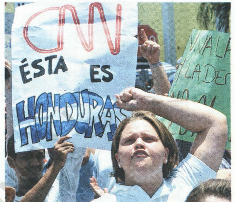
Petición. Los llamados a CNN para que cubra también las protestas contra Zelaya no faltaron.