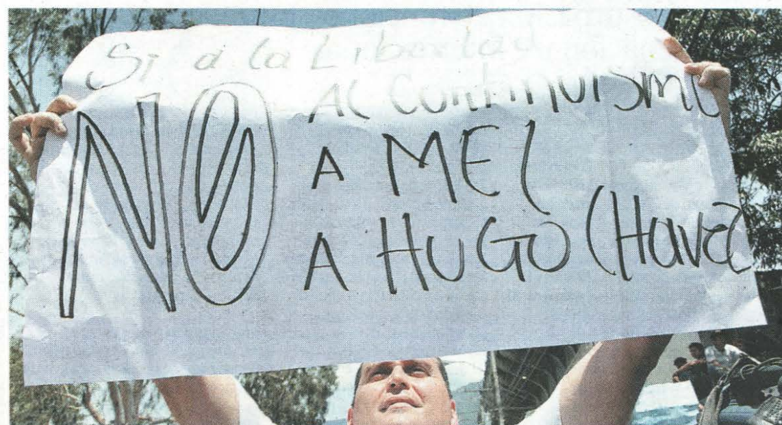
Rechazo. No al socialismo y no a la intervención de Hugo Chávez para seguir teniendo paz, expresaron los sampedranos.