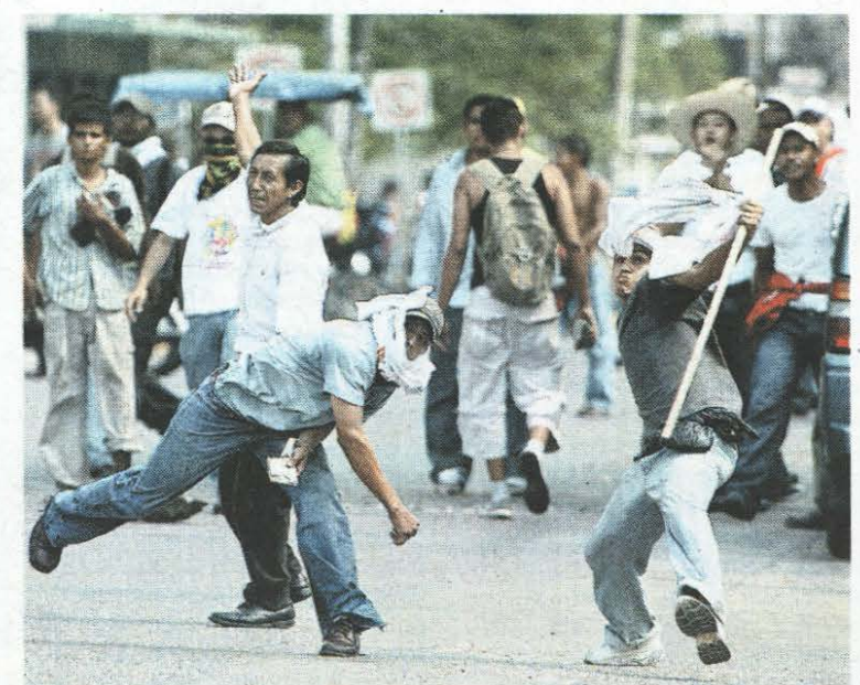
Gente. La turba, cuando subía la primera calle con el objetivo de atacar a las personas que participaban en la marcha.