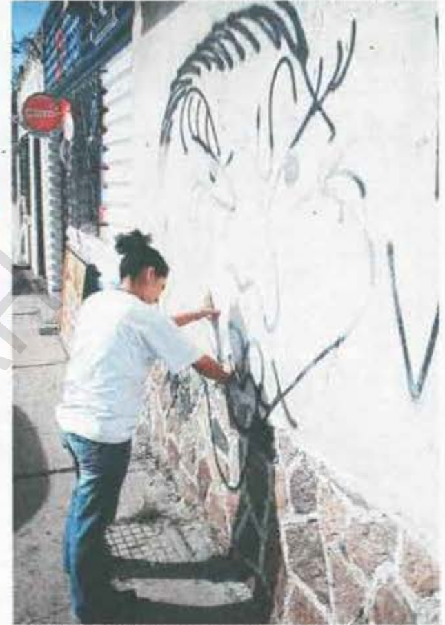
Los capitalinos ya han comenzado a limpiar y pintar las paredes manchadas.