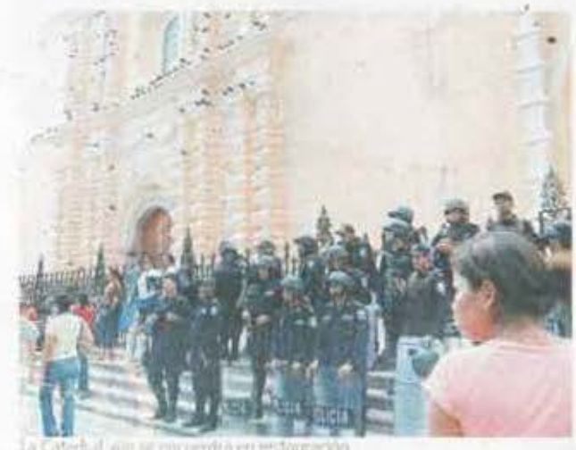
La Catedral aún se encuentra en restauración.

en la parte interna, el sistema eléctrico y solo faltaría el cambio de piso y pintar la nave central", detalló Carlo Magno Núñez, canciller de la Iglesia Católica. La Catedral fue construida en 1756 a un costo aproximado de 7,500 pesos plata. Fue declarada monumento nacional en los años 80. En 2001, la Cooperación Española colabora con los planos y en 2004 autoridades de la Arquidiócesis iniciaron un proyecto de restauración que a la fecha se encuentra en un 70 por ciento avanzada.