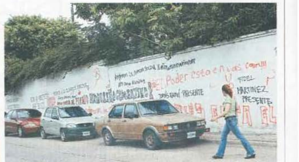
Varias sedes diplomáticas acreditadas en el país no se salvaron de los actos vandálicos de los manifestantes.