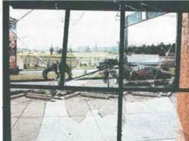
Un negocio de comida rápida resultó con los vidrios rotos con los disturbios del fin de semana.