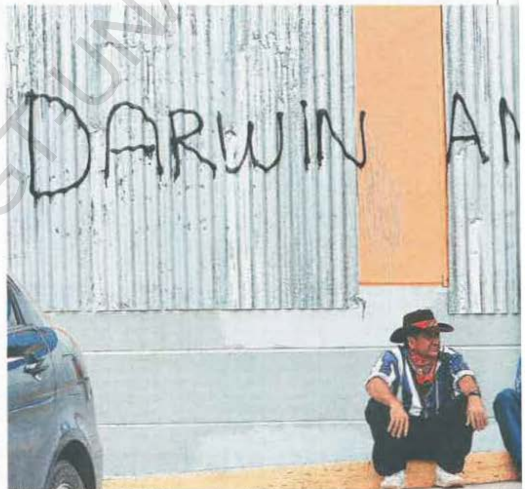
El bulevar Juan Pablo II sirvió hasta de pizarra para los manifestantes.

"El que no estemos de acuerdo con una idea no nos da el derecho de venir a mancillar el derecho de los demás", apuntó el prelado. Los hechos vandálicos también han afectado la iglesia La Merced, que comparte edificio con la Galería Nacional de Arte, el Palacio Arzobispal y la iglesia Inmaculada