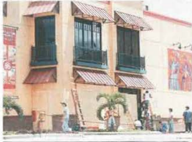
Los dueños de negocios de comida rápida frente al aeropuerto han optado por tapar los ventanales con tablas de madera para evitar daños.

7:00 PM Exposición del Mundo Lenca, cancelada en el Museo del Hombre Hondureño.