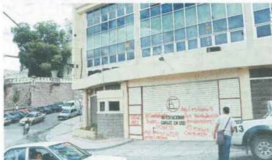
La parte de atrás del edificio del Banco Central de Honduras quedó tapizada de grafitis.