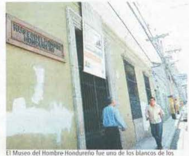
El Museo del Hombre Hondureño fue uno de los blancos de los protestantes.

Concepción en Comayagüela. La Catedral de San Pedro Sula tampoco se escapó, el obispo Ángel Garachana informó que las manifestaciones en el centro de la ciudad alcanzaron el templo con sus grafitis. No obstante, las autoridades eclesiales aseguran que pintarán estos rincones sagrados cuantas veces sea necesario para evitar que sus consignas dañen la moral y la fe de un pueblo religioso. Las autoridades de la gerencia del Centro Histórico de la Alcaldía Municipal, contabilizan al menos 18 inmuebles del patrimonio cultural dañados en el centro de Tegucigalpa. El rayar, ahentar o albeitar un monumento histórico constituye un delito contra el patrimonio