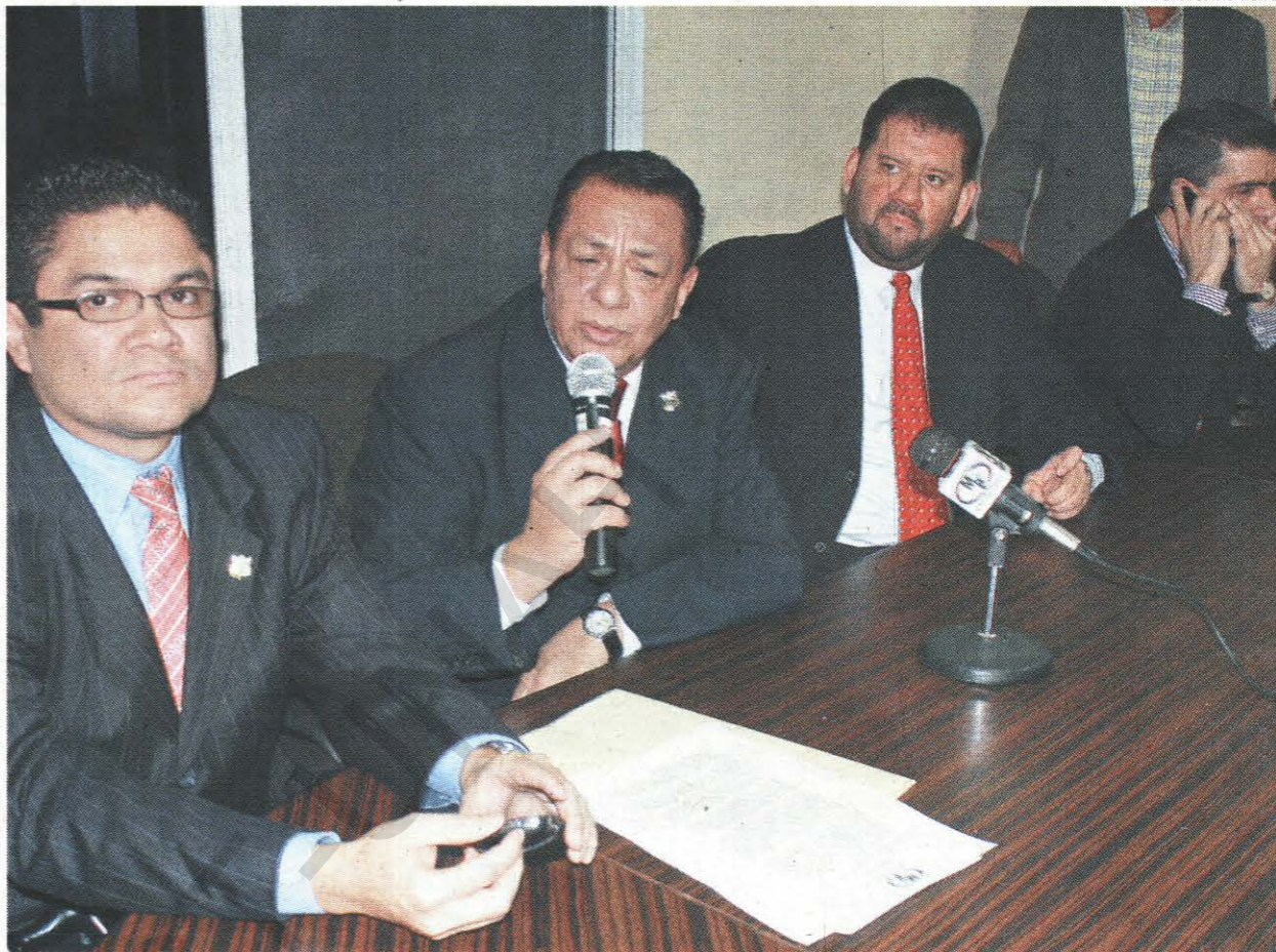
Conferencia. El fiscal general Luis Rubí, junto a las demás autoridades del MP, informó a la comunidad nacional e internacional sobre el requerimiento fiscal interpuesto contra Manuel Zelaya.