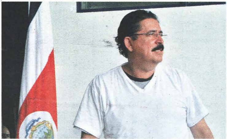
Imputado. El ex presidente Manuel Zelaya fue formalmente acusado por el MP por varios delitos.