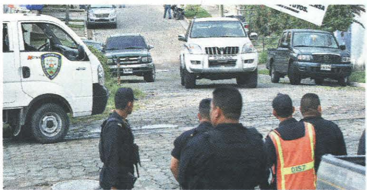
Detención. El ex mandatario fue requerido por militares, la mañana del domingo, para trasladarlo a Costa Rica.