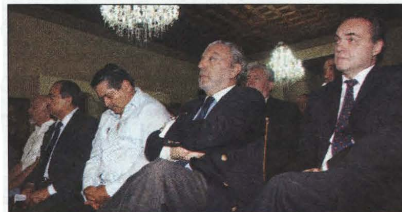
El Cuerpo Diplomático y observadores llegaron hasta Casa Presidencial para escuchar las explicaciones del Gobierno en relación a la Consulta de Opinión que se realizará hoy.

Los más de 25 observadores internacionales, la mayoría de izquierda, que llegaron al país procedentes de países como: Chile, Argentina, Nicaragua, El Salvador, estarán observando el proceso de la consulta de opinión.