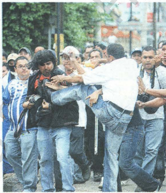
Salvajismo. De forma salvaje un apoderado legal de una asociación, quien ya fue identificado por el MP, golpea al reportero.