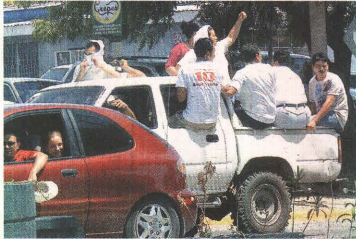
El Progreso. Los comercios cerraron por temor a las turbas que apoyan al ex presidente Manuel Zelaya Rosales.

E l Progreso. Un día irregular y de escasa actividad comercial vivieron ayer los ciudadanos de la "Perla del Ulúa".