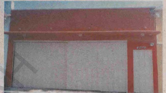
Esta es la vivienda ubicada en Lomas del Guijarro.