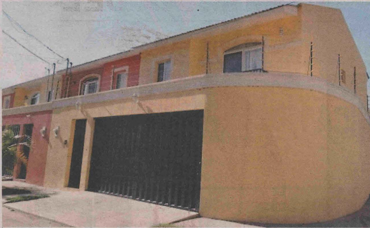
Esta casa amarilla de dos plantas la compró en Miraflores Sur por 2.5 millones con un préstamo bancario que pagó semanas después.