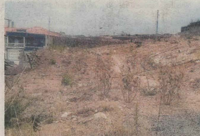
Varios terrenos han sido decomisados por el Ministerio Público.