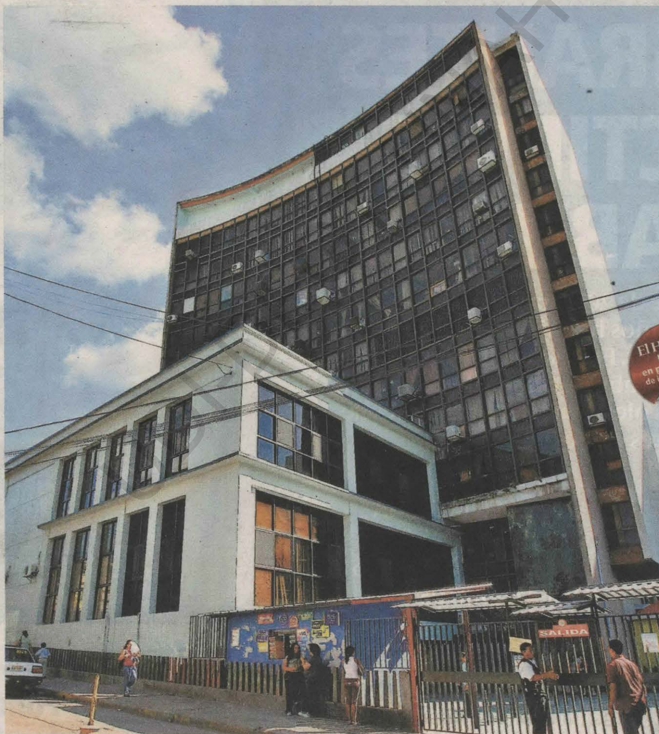
El IHSS se encuentra en una crisis que no tiene precedentes debido al desfalco del que fue objeto por parte de varios exfuncionarios.

De igual manera, el nombre de las empresas está identificadas, pero no pueden revelarlas