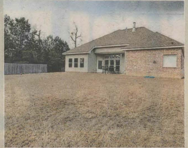
En la parte trasera de la casa hay una extensa área cercada que sirve como patio o jardín.