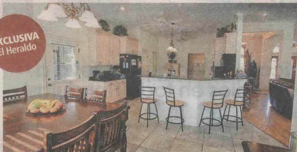
Un comedor de madera y al fondo la cocina con muebles de granito hay en la parte trasera del inmueble.

El techo tiene diversas molduras y en el porche hay un sistema de riego, así como un patio