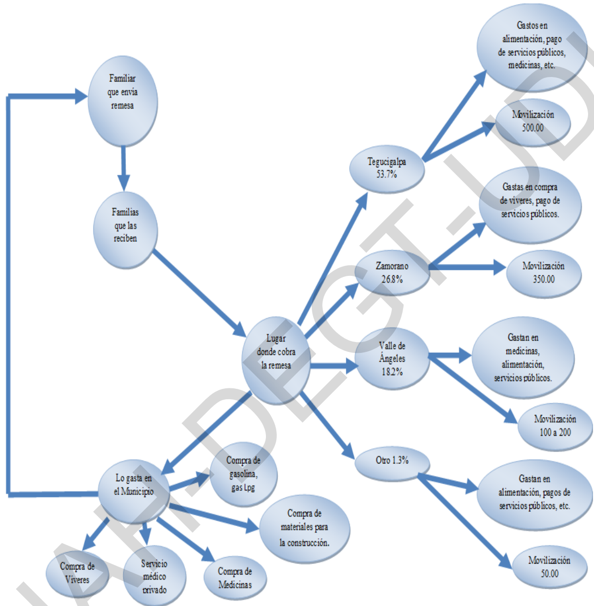
Figura 1. Proceso o Ciclo de la Remesas del Municipio de la Villa de San Francisco 4

La figura 1 muestra toda la trayectoria que realiza la remesa desde el momento que llega al país a través de una institución bancaria y que porcentaje se destina según la necesidad que surge en el hogar.