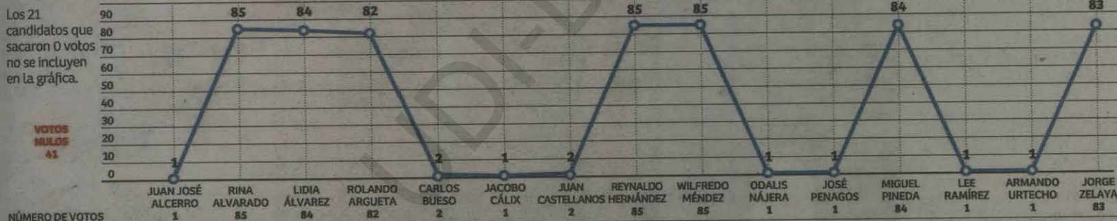
INFOGRAFÍA: JORGE GALLO/LA PRENSA

con el escrutinio de la última papeleta que para mala fortuna de los candidatos fue clave para decidir la no elección de tres posibles magistrados.