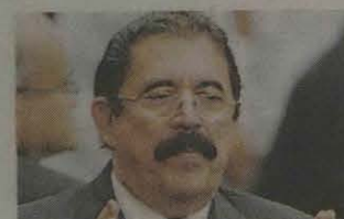
MANUEL ZELAYA Diputado Libre

"NO HAY TRANSPARENCIA EN ESTA ELECCIÓN, NOS DEBEN LLAMAR A NEGOCIAR"