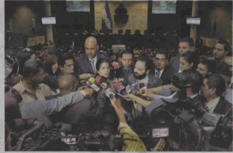
La bancada de PAC quedó más dividida entre esta facción "nasrallista" y los denunciados.