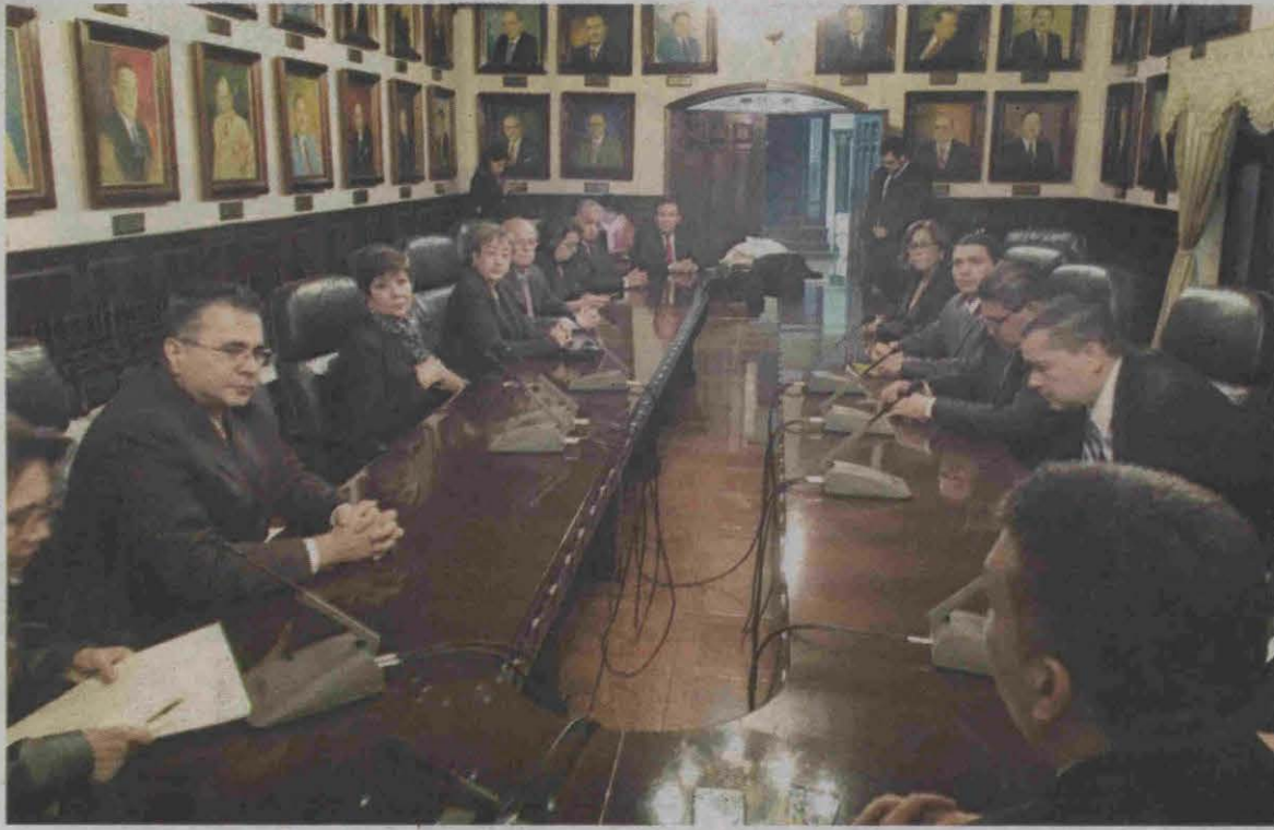
La primera sesión de los magistrados de la Corte Suprema de Justicia fue en el Salón de Retratos del Congreso Nacional para elegir a su presidente, por unanimidad.

congresistas del PAC que votaron en secreto.