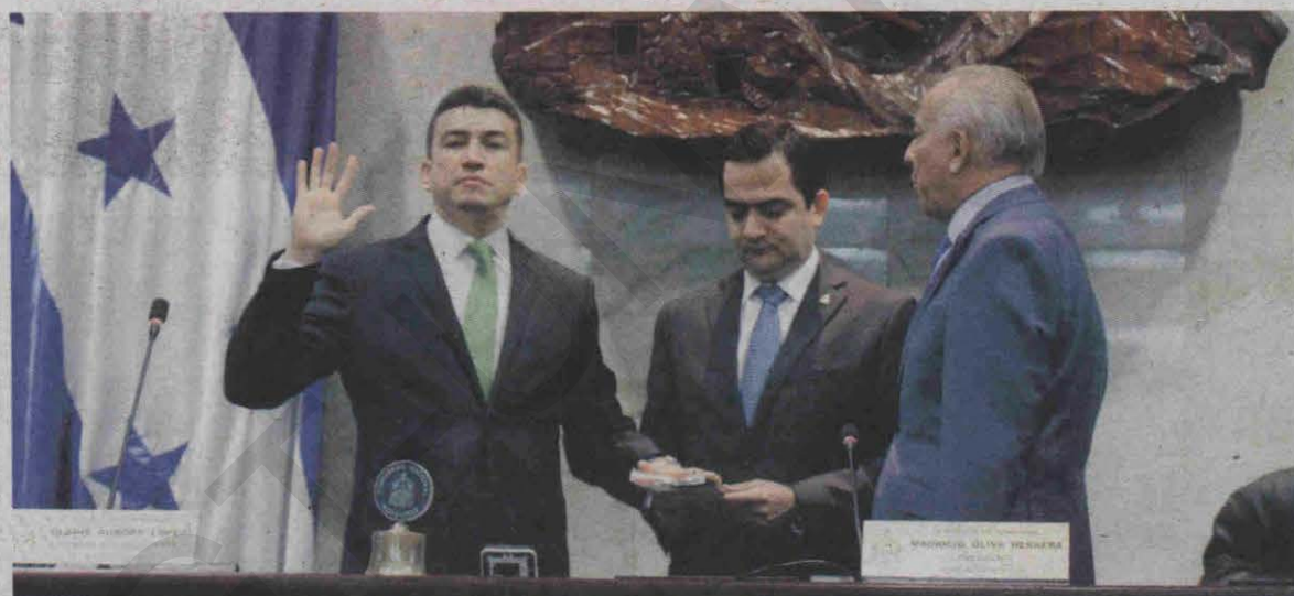
El presidente del Poder Judicial, Rolando Argueta, al presentar su juramento sobre la Constitución de la República.

Antes de la votación, las mujeres diputadas de los distintos partidos se solidarizaban con las diputadas Ana Joselina Fortín, Kritza Pérez y Marlene Alvarenga por haber sido agredidas verbalmente, por el expresidente, Salvador Nasralla.