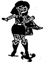
ONCORAD S.A. DE C.V.