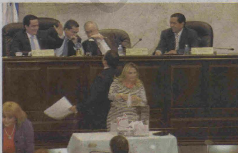
El ambiente en la cuarta votación secreta transcurrió con toda tranquilidad y en un clima de respeto entre los diputados de las distintas bancadas, nada que ver con las broncas anteriores.

En seguida, el presidente del Congreso, Mauricio Oliva, saludó al diputado del PAC, Luis Redondo, por estar recuperado de su operación qui-