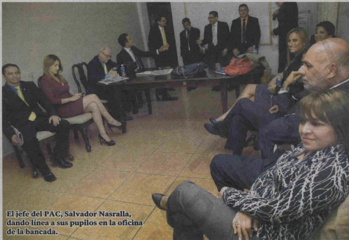
El jefe del PAC, Salvador Nasralla, dando línea a sus pupilos en la oficina de la bancada.