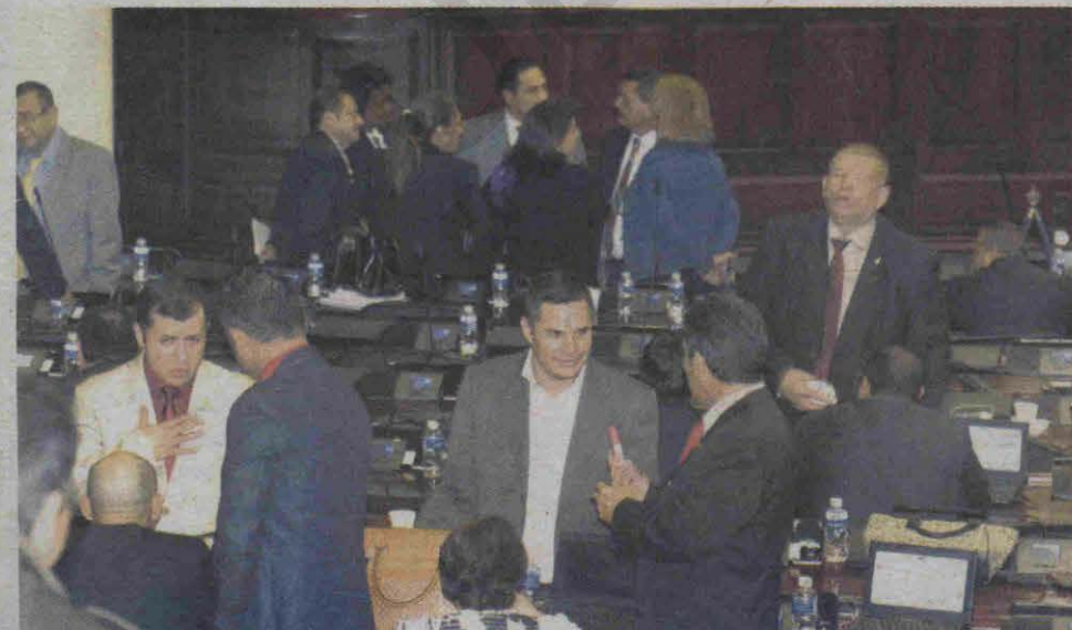
Al fondo se ven los liberales cabildeando y en primer plano, los diputados de Libre afinando su "guión".

Después del escrutinio y al cierre de este rotativo, el presidente del Congreso Nacional convocó unas horas después a una nueva votación que continuaría a la medianoche y madrugada de hoy miércoles. (JS)