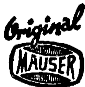
figura elíptica, y leyéndose arriba y fuera de la misma, la palabra: "Original", en letra cursiva, tal como se muestra en las etiquetas que se acompañan; para distinguir: armas de fuego, munición y sus partes, y la cual se aplica a los artículos, cajas y empaques que los contienen, grabándola, estampándola, imprimiéndola, por medio de etiquetas o placas metálicas que se les adhieren y en cualquiera otra forma apropiada en el comercio. Presento el poder para que se razone en lo conducente, los demás documentos de ley y

La infrascrita, Jefe de la Sección de Patentes y Marcas de Fábrica, dependiente de la Secretaría de Economía y Hacienda, hace saber: que con fecha 15 de mayo del año en curso, se admitió la solicitud que dice: "Registro de Marca.— Señor Ministro de Economía y Hacienda.—En representación de Mauser-Werke Aktiengesellschaft, domiciliada en Oberndorf a. Neckar, Wurttemberg, Klosterstrasse 3, República Federal de Alemania, vengo a pedir el registro inicial, por no haber sido registrada antes en otro país, de la marca de fábrica consistente en la palabra: "Mauser", escrita dentro de una