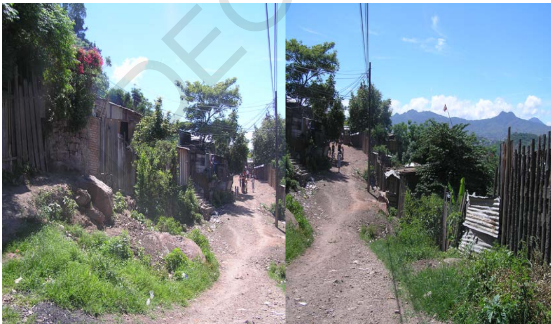
Foto calle principal lado lateral

Además la mayoría de las viviendas han hecho vivienda una tras otra lo que demuestra que las familias se han quedado viviendo en la zona.