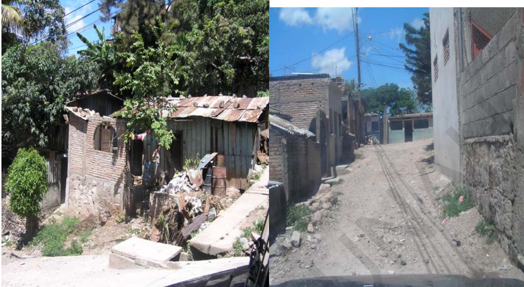
Calles estrechas final de la colonia