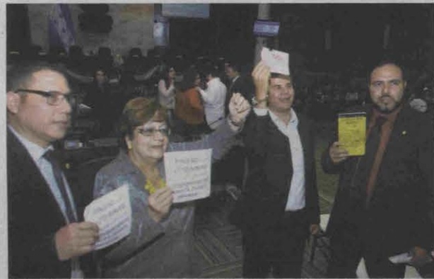
Diputados de la oposición se "enchacharon", al tiempo de exigir la votación pública.

Podría aplicarse el magistrado más votado, como en las primarias