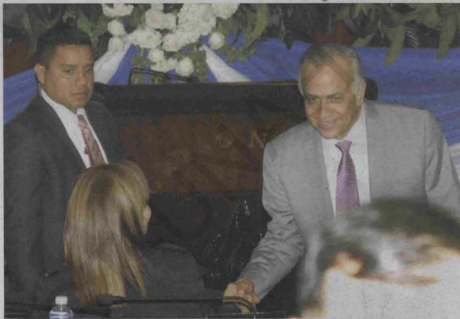
Luego de dar por terminada la sesión de ayer, el presidente del Congreso Nacional, Mauricio Oliva, bajó a la Cámara para saludar y dialogar con diputados de diferentes bancadas.