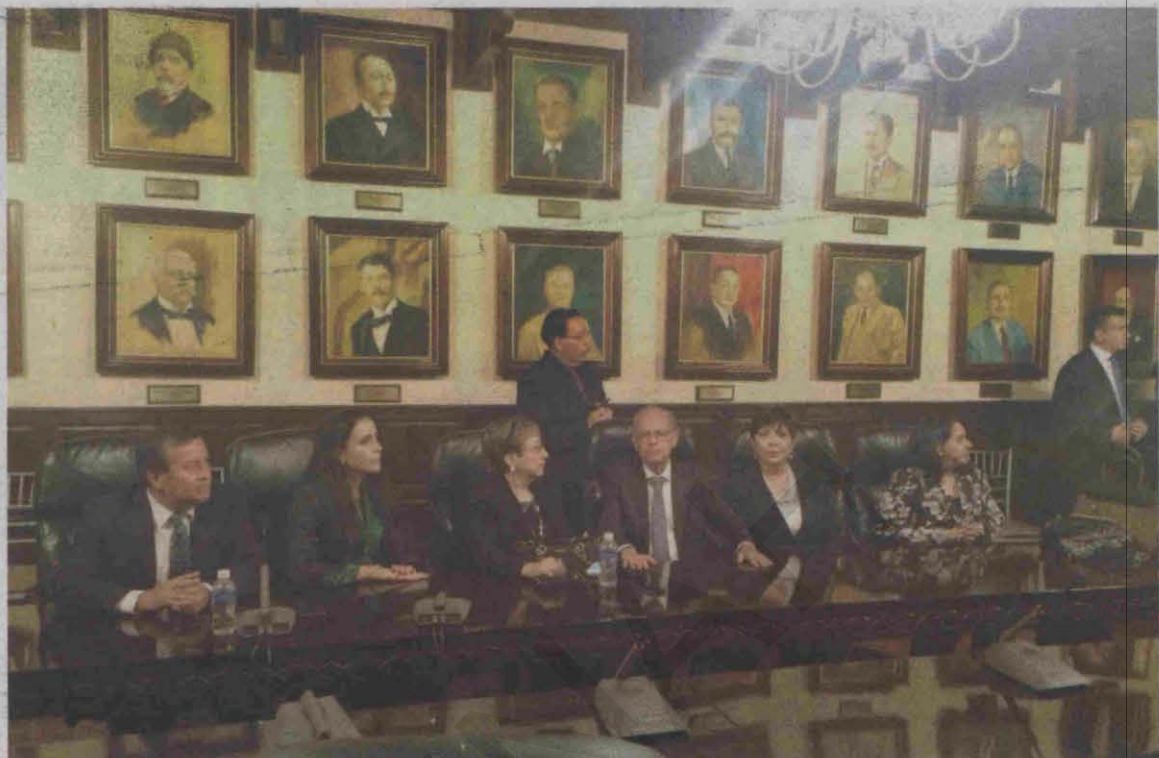
Los nominados se quedaron vestidos y alborotados en el Salón de Retratos, viendo por televisión cómo se escapaba la elección.