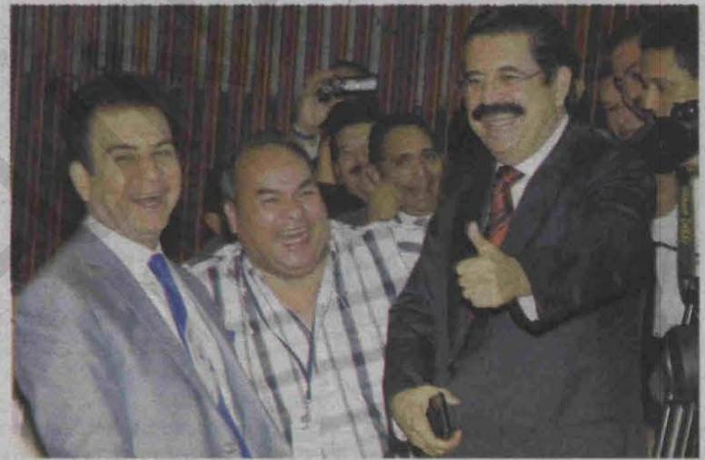
Mientras llegaba la votación, Nasralla y el expresidente Zelaya mejor armaron sus propias tertulias con los cronistas parlamentarios.