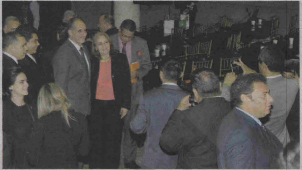
El alcalde capitalino "Tito" Asfura fue el hombre más "foteado" en la ceremonia de instalación de la tercera legislatura.