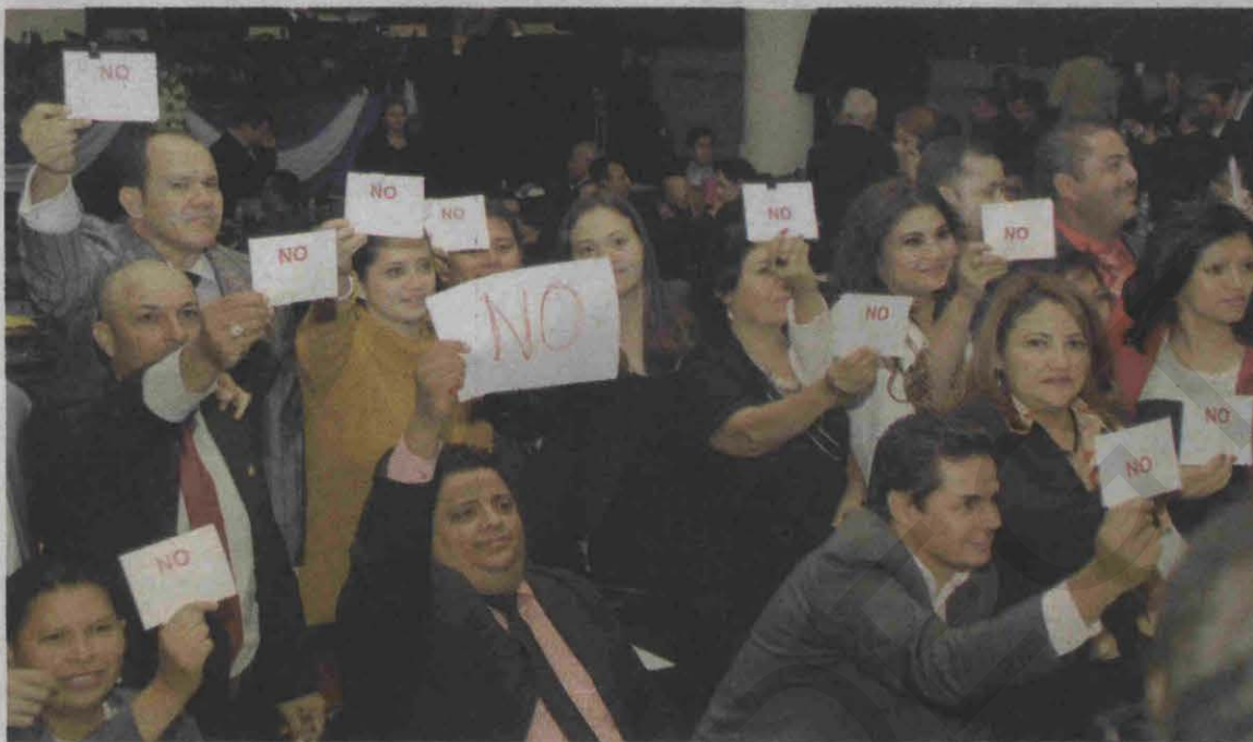
Esta vez, los diputados de Libre cambiaron los pitos y los pumponeos por una cartulina con el "No" a la nueva CSJ.