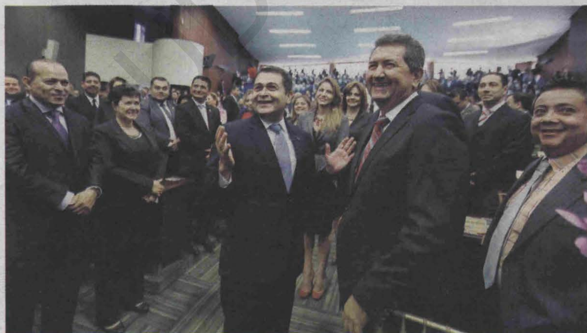
El Presidente Juan Orlando Hernández cuando la bancada de su partido grita que llegó el “El papá de los pollitos”.

El coordinador del PAC escribió en una pizarra los nombres de algunos magistrados y fue fotografiado junto a sus diputados leyendo un papel. Ellos tenían