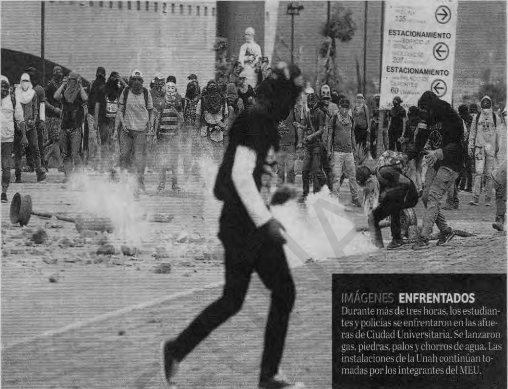
IMÁGENES ENFRENTADOS Durante más de tres horas, los estudiantes y policías se enfrentaron en las afueras de Ciudad Universitaria. Se lanzaron gas, piedras, palos y chorros de agua. Las instalaciones de la Unah continúan tomadas por los integrantes del MEU.