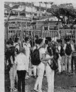
ACCIÓN. Alumnos de Medicina frenaron toma de edificio.

TEGUCIGALPA. Enfurecidos estudiantes que al unísono gritaban "¡que los linchen, que los linchen!" desalojaron a un pequeño grupo de personas encapuchadas que la mañana de ayer se tomaron la Facultad de Ciencias Médicas de la Universidad Nacional Autónoma de Honduras (UNAH). Desde horas muy tempranas, jóvenes, presuntos estudiantes que andaban con los rostros cubiertos, se tomaron las instalaciones donde reciben clases los estudiantes de Medicina. En el portón principal colocaron cadenas y candados al igual que la Bandera Nacional, con lo que no permitían el ingreso de alumnos ni de docentes. Los estudiantes que llegaron como todos los días a recibir sus clases mostraron el malestar y solicitaron a los encapuchados que se retiraran