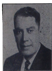
Dr. Juan Manuel Galvez POPULARMENTE ACLAMADO PARA EL EJERCICIO DE LA PRESIDENCIA DE LA REPUBLICA EN EL PROXIMO PERIODO. HONRADEZ--ECUANIMIDAD RECTITUD