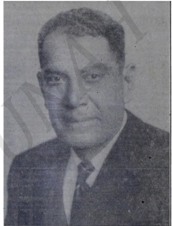
Dr. JUAN MANUEL GALVEZ