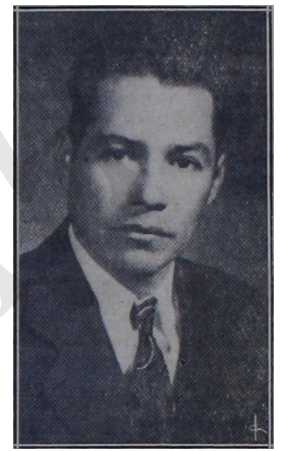
Coronel Guadalupe Umanzor

Acete de Tiburón botellas o latas. Aletas y cecina secas por arrobas o quintales. Cueros frescos y salados San Lorenzo, Valle.—Honduras.