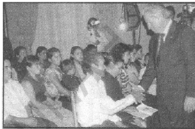
El presidente Maduro pidió disculpas a los familiares de dos desaparecidos

La convivencia armónica de la sociedad se fundamenta en el respeto absoluto a los principios constitucionales que estructuran la vida en la comunidad, agregó.