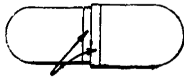
FRANJA COLOR AMARILLO

La infrascrita, Jefe de la Sección de Patentes y Marcas de Fábrica, dependiente de la Dirección General de Economía y Comercio, hace saber: que con fecha 15 de enero del año en curso, se admitió la solicitud que dice: "Registro de Marca.—S e ñ o r Ministro de Economía y Hacienda.—En representación de Parke, Davis & Company, corporación del Estado de Michigan, domiciliada en la ciudad de Detroit, en dicho Estado, Estados Unidos de América, vengo a pedirle el registro de la marca de fábrica inscrita en la República Argentina, con el número 372.753, el 6 de noviembre de 1956, por un período de diez años, para distinguir: sustancias y productos usados en medicina, farmacia, veterinaria e higiene; drogas naturales o preparadas; aguas minerales, vinos y tónicos medicinales; e insecticidas de uso doméstico; consistente en una franja de color amarillo que circunda,