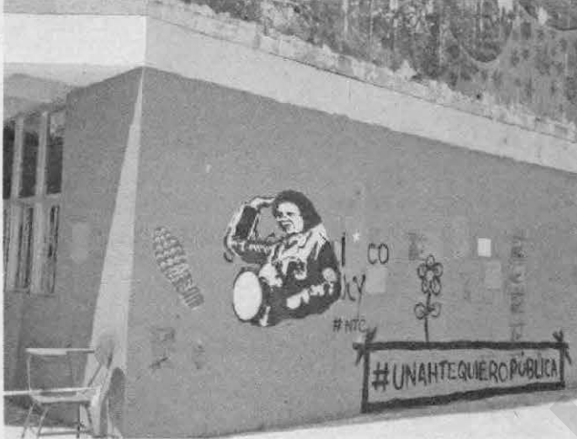
También pintaron consignas contra la rectora.

Cabe mencionar que se manejan reiteradas diferencias entre el Movimiento Estudiantil Universitario (MEU), uno de los movimientos que encabeza la protesta estudiantil que