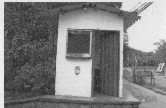
Además de golpear a los guardias, dañaron la infraestructura de la garita.

En el comunicado, consideran que son acciones de parte de las autoridades universitarias, en pro de crear excusas para militarizar las instalaciones, reprimirlos e intimidarlos para que desistan de su lucha. Enfatizan que no callarán e instan a la población a analizar el contexto que los responsabiliza de acciones vandálicas que ellos no han cometido.