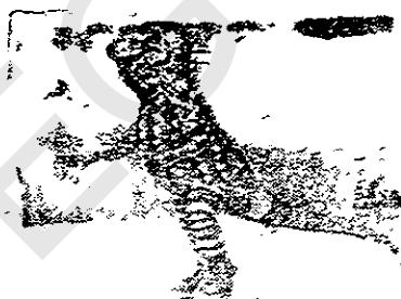
JUANA LA IGUANA

PRODUCTOS Aparatos e instrumentos científicos, náuticos, geodésicos, eléctricos, fotográficos cinematográficos, ópticos, de pesar, de medida, de señalización, de control (inspección), de socorro (salvamento) y de enseñanza, aparatos para el registro, transmisión reproducción de sonido o imágenes, soportes de registro magnéticos, discos acústicos, distribuidores automáticos y mecanismos para aparatos de previo pago, cajas registradoras, máquinas calculadoras, equipo para el tratamiento de la información y ordenadores, extintores