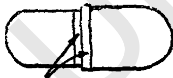
FRANJA COLOR AZUL

La infrascrita, Jefe de la Sección de Patentes y Marcas de Fábrica, dependiente de la Dirección General de Economía y Comercio, hace saber: que con fecha 15 de enero del año en curso, se admitió la solicitud que dice: "Registro de Marca.—Señor Ministro de Economía y Hacienda.—En representación de Parke, Davis & Company, corporación del Estado de Michigan, domiciliada en la ciudad de Detroit, en dicho Estado, Estados Unidos de América, vengo a pedirle el registro de la marca de fábrica inscrita en la República Argentina, con el número 381.473, el 19 de agosto de 1957, por un período de diez años, para distinguir: sustancias y productos usados en medicina, farmacia, veterinaria e higiene; drogas naturales e preparadas; aguas minerales y tónicos medicinales; e insecticidas de uso doméstico; consistente en una franja de color azul que circunda, más o menos, a la mitad de su altura, una cápsula que