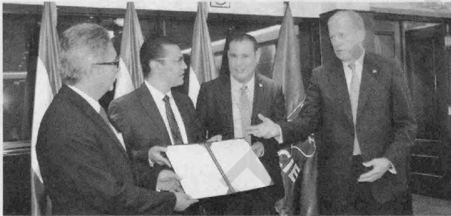
Los delegados de El Salvador, Honduras y Nicaragua entregando la carta al presidente del BCIE.

El delegado presidencial por Honduras destacó que la entrega de la carta oficial "es un gran avance para la integración centroamericana, la prueba del compromiso de los tres países es justamente que los tres presidentes ce-