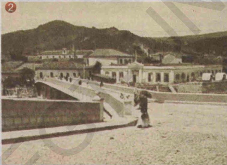
2 El histórico puente Mallol a la derecha la Escuela de Artes y Oficios en Coamayagüela, al fondo Las Crucitas.

dado por las autoridades del Ayuntamiento para honrar la memoria del último alcalde peninsular que comenzó a construirlo en 1818 con el diseño del arquitecto guatemalteco Juan Bautista Jauregui.