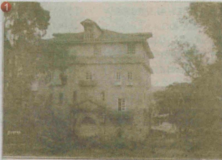
1 “La Alambra” en el sector de La Leona, sede de la Escuela Normal de Varones en 1906.