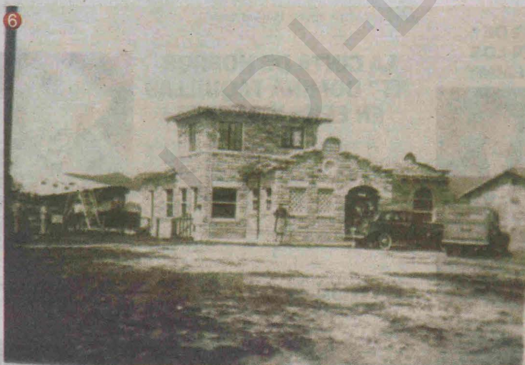
La antigua terminal área de Panam en Toncontín.

Feliz día de la patria y hasta la próxima semana.