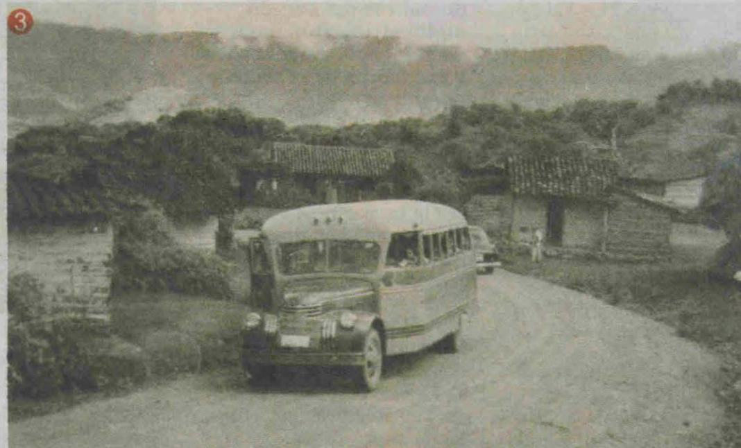
3 Un autobús tomando la última vuelta para llegar a Suyapa por vieja carretera a oriente.

como paso sobre el Río Grande ha cumplido el Puente Mallol nombre