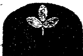
PILONCITO VERDE S.A. excelencia con tecnología nuestro producto