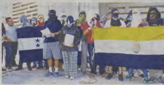
Los integrantes del MEU están en desacuerdo con varios puntos, aprobados en el dictamen del Congreso Nacional.

"El MEU no se apega a la resolución brindada por el Congreso Nacional, porque existe una contradicción legal en querer legitimar la ilegalidad del nombramiento de una junta de Dirección Universitaria que por ley cesó de sus funciones el 29 de abril del 2017 y no se realizó el debido proceso que estipula la Ley Orgánica para su con-