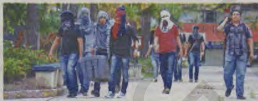
Los dirigentes estudiantiles se reunirán hoy con los Claustros de Docentes para construir en conjunto una propuesta de reprogramación del II periodo académico.