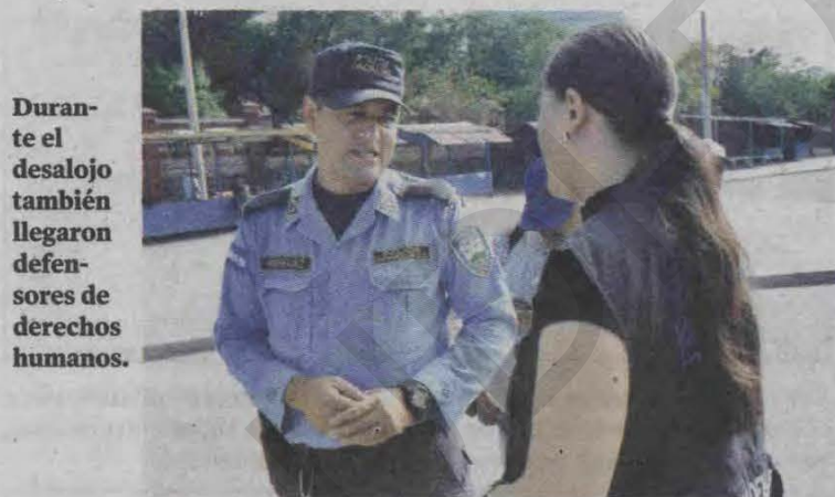
Durante el desalojo también llegaron defensores de derechos humanos.

Aclaró que “el campus va estar cerrado a las 9:00 de la noche y nadie podrá quedarse en su interior, a las 9:30 de la noche con el apoyo de la Policía se hará una ronda porque nadie se debe quedar en los edificios. Para eso haremos un convenio con la Policía y nuestros abogados para que se haga, porque no queremos que vuelva a pasar que estudiantes