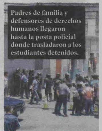
Padres de familia y defensores de derechos humanos llegaron hasta la posta policial donde trasladaron a los estudiantes detenidos.