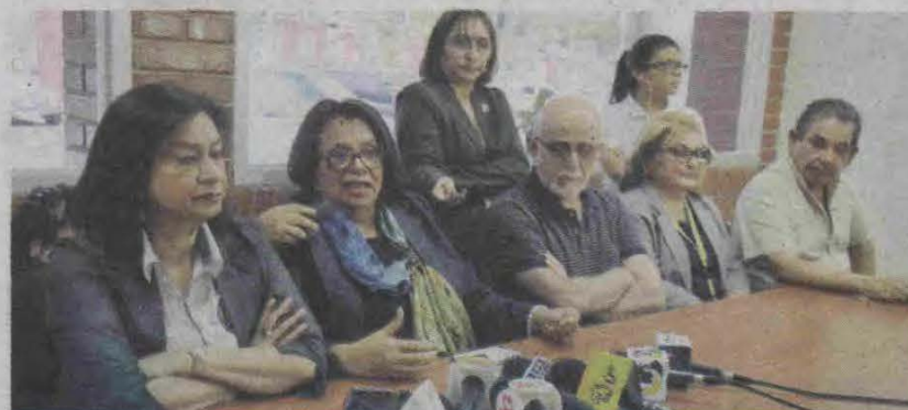
Las autoridades universitarias advirtieron que si el MEU persiste con la actitud de retomar acciones violentas, que provoquen la interrupción de las clases, no habrá más alternativa que cancelar el II período académico.