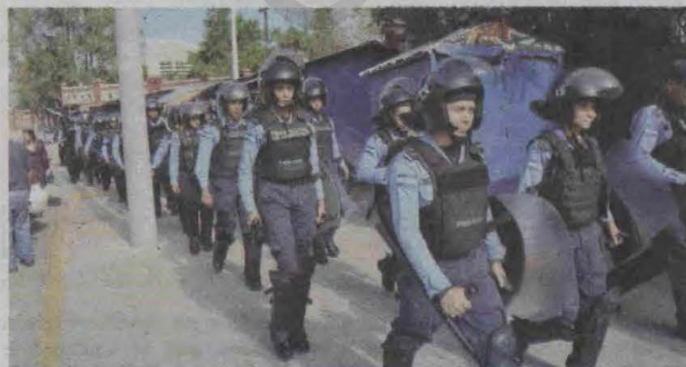
Los agentes de la Policía Nacional llegaron desde temprano en la mañana a la Universidad Nacional.