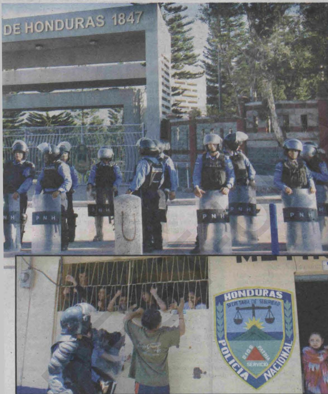
Los estudiantes fueron trasladados a las instalaciones de la Jefatura Metropolitana I, más conocida como Core 7, ubicado en el sector de Los Dolores en el centro de la capital.

estén en las instalaciones en horas que no son de estudio”.