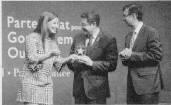
La transparencia y rendición de cuentas en los proyectos de infraestructura ya fue reconocida mundialmente a Honduras, en Londres, por la casa matriz.

CoST Honduras será el país anfitrión y se espera la participación de las representaciones de Honduras, Panamá, Costa Rica, El Salvador y