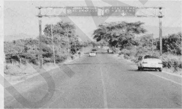
SISOCS es la plataforma de transparencia donde hay información veraz sobre las obras y contratos del Estado con el sector privado.

Un informe publicado recientemente por CoST Internacional revela que "sin mejoras significativas en la oferta de la infraestructura pú-