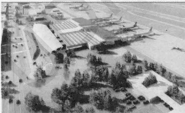
Proyectos como la construcción del aeropuerto de Palmerola están en la plataforma de transparencia.

De esta forma Centroamérica da un paso firme hacia los procesos de fortalecimiento de las capacidades para transparentar los proyectos de infraestructura pública en el istmo.